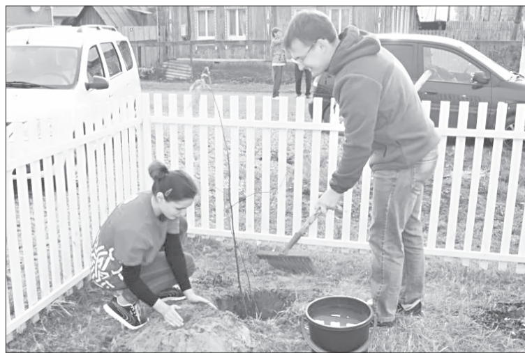
Волонтеры медицинского колледжа на территории Асланинского ФАПа высадили саженцы рябины

Его цель - улучшение состояния фельдшерско-акушерских пунктов, а также повышение доступности медицинских знаний и оказания услуг