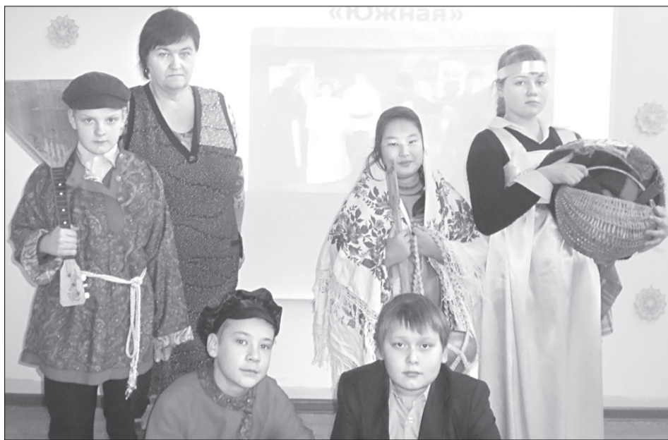
Сценарий по истории создания родной деревни школьники написали сами

Мы играем отрывки из больших спектаклей и просто сценки из повседневной и школьной жизни, которые пишем сами. Так, в прошлом сезоне нашим зрителям понравилась сказка «Золушка» на