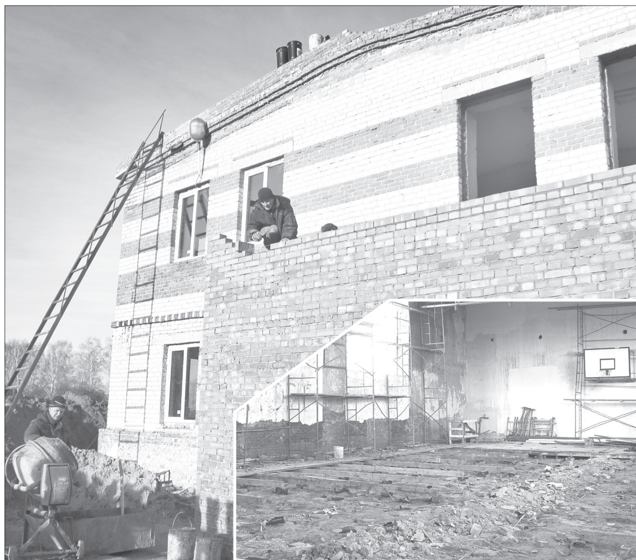
С правой части здания ДЮСШ теперь будет пристрой для дополнительной пожарной лестницы, а вот в спортзале работы только начались

Если всё пойдет по плану, весной горожане увидят новую бело-синего цвета ДЮСШ, и уже на летних каникулах она вновь распахнет двери для юных спортсменов.