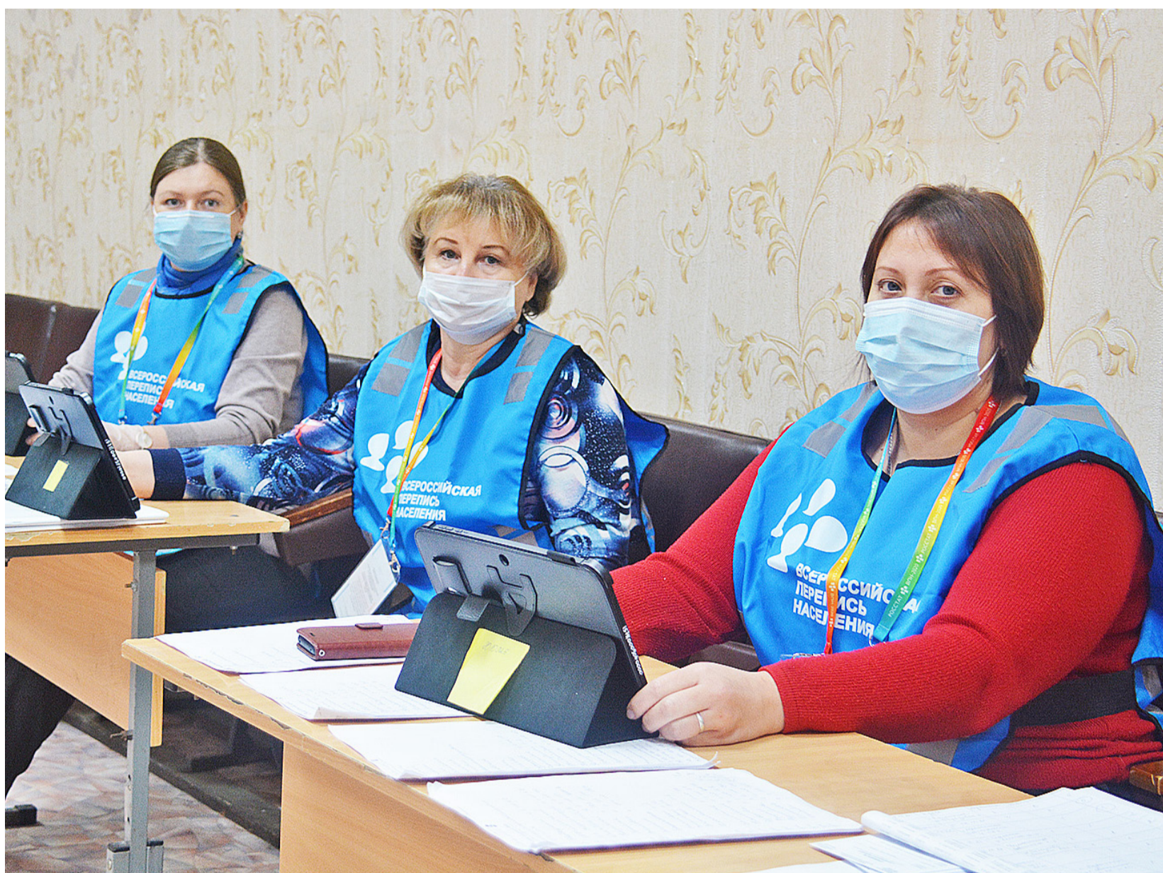
Каждый переписчик обошёл от 160 до 190 домовладений

14 ноября в стране завершилась Всероссийская перепись населения