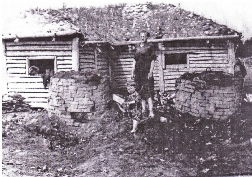
Дегтярня, расположенная недалеко от села Афонькино. В 50 – 60-е годы в районе гнали дёготь