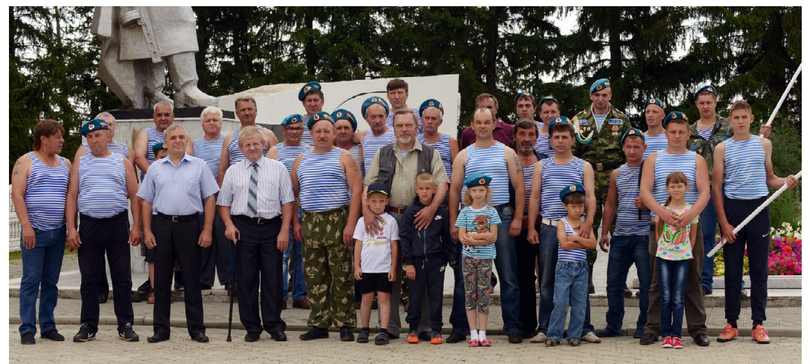
Общее фото на память