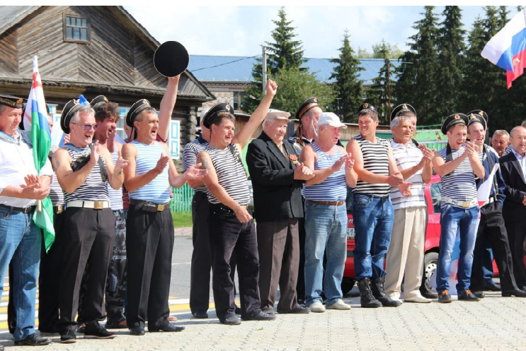
«Семь футов под килем»