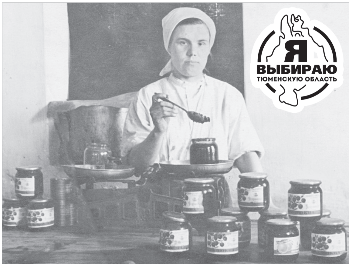
Производство варенья было нелёгкой работой: ведь механизация, по сути, отсутствовала