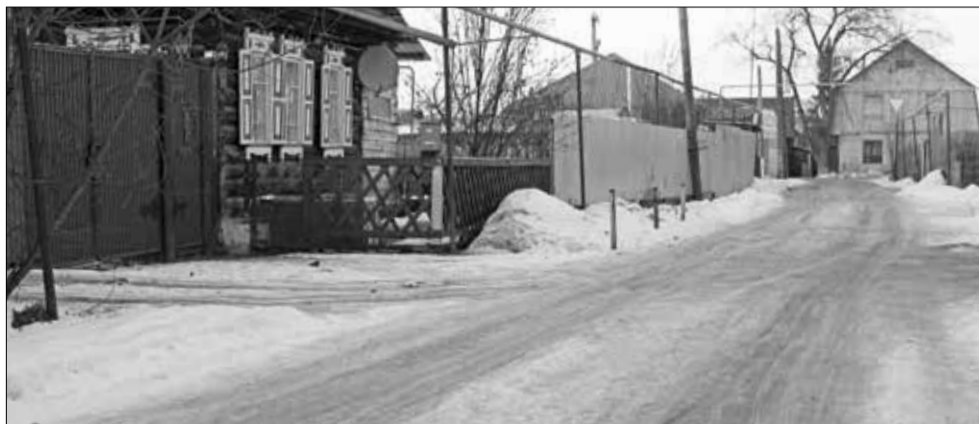
От перепадов температуры дорога по переулку Красноармейскому превратилась в ледовый каток