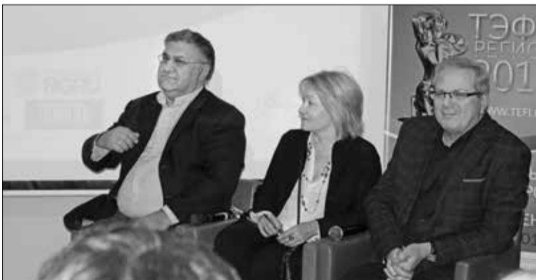
Оценивало работы конкурсантов компетентное жюри

В Тюмени прошёл финал Всероссийского телевизионного конкурса «ТЭФИ-Регион» – 2017, учредителем которого выступает фонд «Академия российского телевидения». В этом году за бронзового «Орфея» и «Золотой» диплом победителя конкурса боролись рекордное количество участников. Телевизионное жюри просмотрело 573 работы, отправленные из 84 населённых пунктов страны. Борьба за семи-