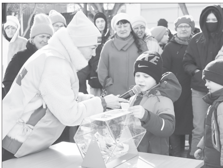
Желающих ответить на вопросы викторины и затем поучаствовать в розыгрыше было немало

- Я даже не знал, что в этот раз Масленица будет здесь,