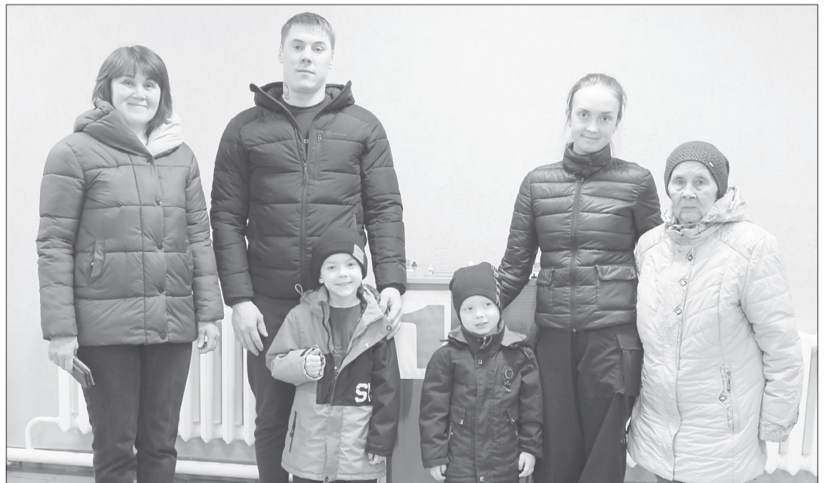
Большая семья Лендьел из Хохлово на выборы пришла в полном составе

Все возрасты. Три дня голосования дали жителям страны возможность решить, когда удобнее прийти. Свообразные волны на участках наблюдались в пятницу с утра, когда ялutorовчане заходили голосовать перед работой, в обеденный перерыв и вечером. В привычный ранее день голосования - воскресенье люди шли семьями, с детьми, бабушками и дедушками. Высокую активность по-