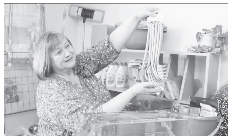
Все жители Ялуторовского района, которые приняли участие в викторине, получили подарки - предметы, полезные в быту. А победители суперрозыгрыша ещё и технику

ные акции, мастер-классы, работали полевая кухня, палатки здоровья, - рассказала директор Центра культуры и досуга Ялуторовского района