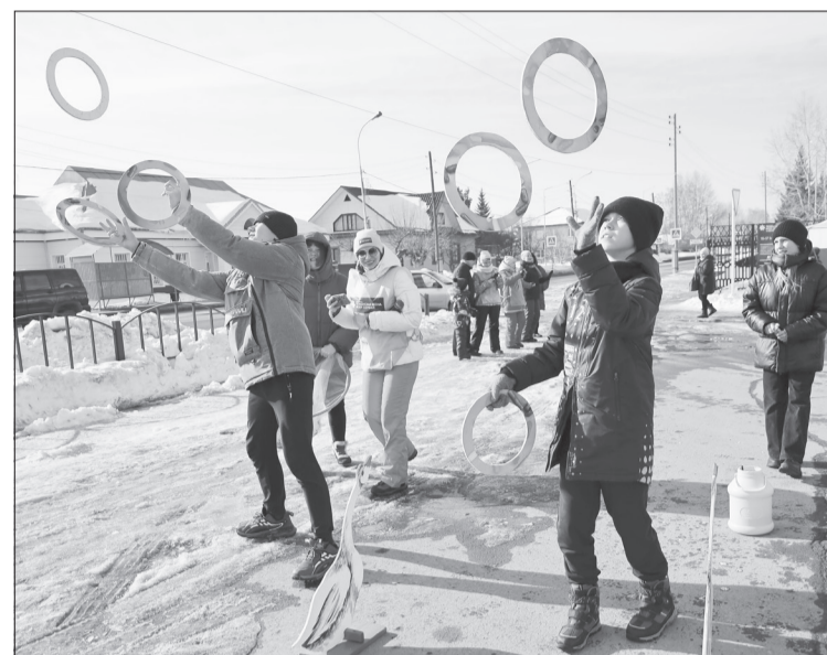
Организаторы площадок приготовили самые разные развлечения

111 главных подарков разыгрывали отдельно. Всё традиционно: талоны участников загружали в барабаны и волей фортуны выбирали счастливыхчиков. Жители района стали обладателями новых телевизоров, пылесосов, мясорубок, бензопил, микроволновых печей, культиваторов «Торнадо» и других предметов, необходимых в хозяйстве.