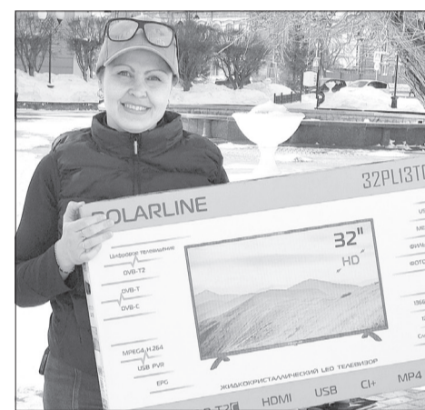
Ялуторовчане радовались телевизорам, их выдали 200 штук