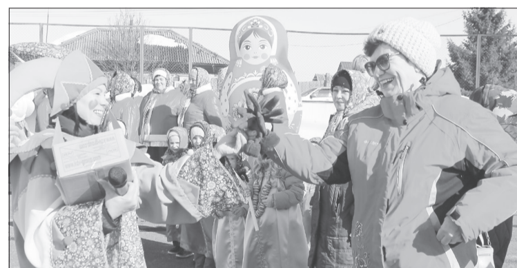
На празднике в Хохлово к играм охотно подключались не только дети, но и взрослые

- На наших площадках прошли семейные конкурсы, спортивные и патриотические мероприятия, благотворитель-