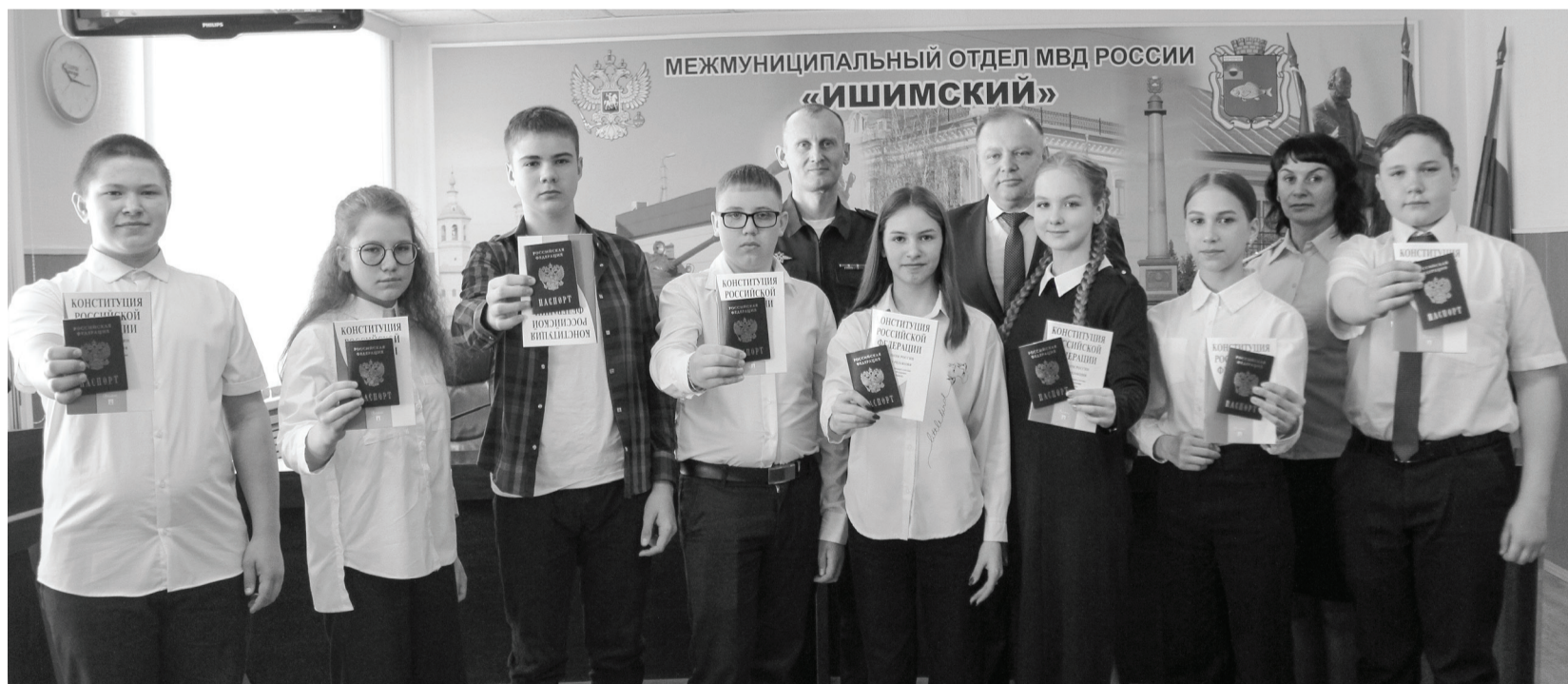
Получение паспорта в первый раз – это билет во взрослую жизнь. В 14 лет у подростков появляются новые права (например, можно официально трудоустроиться) и обязанности.

– Это самый важный юридический документ нашего государства, с него начинается все законодательство. Именно здесь вы найдете информацию о правах, свободах и обязанностях граждан РФ, – рассказал Роман Валерьевич. – Вы – граждане огромной и сильной державы и можете этим гордиться. Такой документ хотели бы получить многие жители других стран, вам он дается