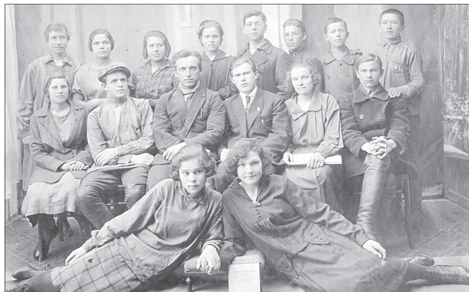
На уникальной фотографии из фондов музейного комплекса - группа молодых людей - учащихся политшколы. Снимок датирован 1920-ми годами. Кто на нем изображен, неизвестно. Возможно, читатели, вы нам поможете

Первые комсомольские организации в Ялуторовске появились в 1919 году, после освобождения города от войск адмирала Колчака.