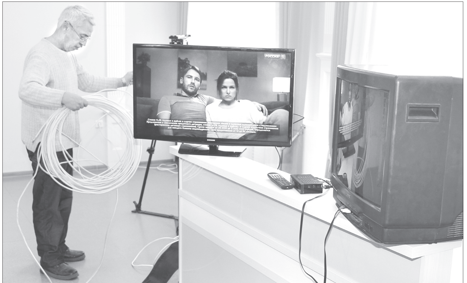
Новые телевизоры принимают цифровой сигнал без дополнительных устройств, а старым для этого нужна приставка

Стоимость подписки на полугодие: в редакции «ЯЖ» - 420 руб., на «Почте России» - 685, 74 руб.