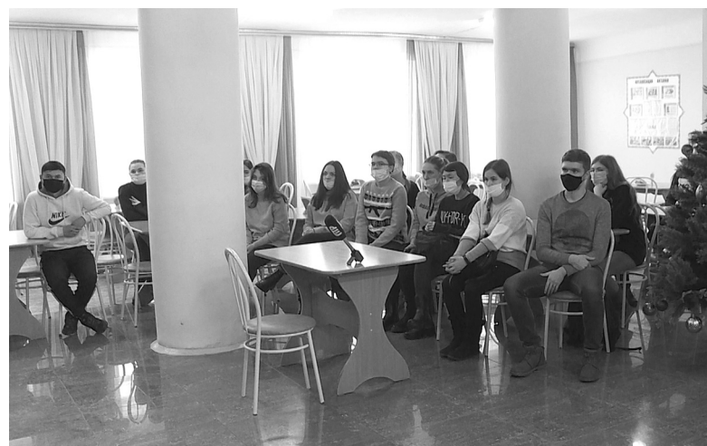
Студенты 3-5 курсов ГАУ Северного Зауралья заинтересовались предложением работы в ООО «Руском»

– Свою профессиональную деятельность я хотел бы начать в цехе переработки бройлера. Есть желание приехать сюда для прохождения преддипломной практики и потом остаться