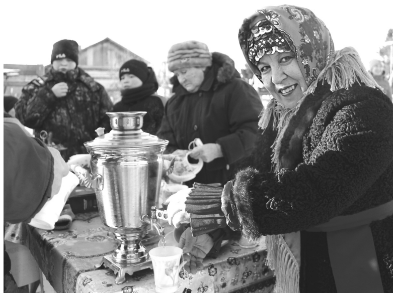
На чувашском подворье – праздник с горячим чаем

В этот день в селе Медведево звучали вперемешку песни на чувашском и русском языках. Уже пять лет в сибирском селе светит людям «Лучик Аван».