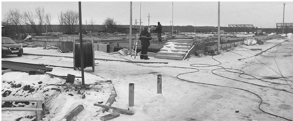
В феврале этого года обещают сдать в эксплуатацию новый детский сад в Евсино