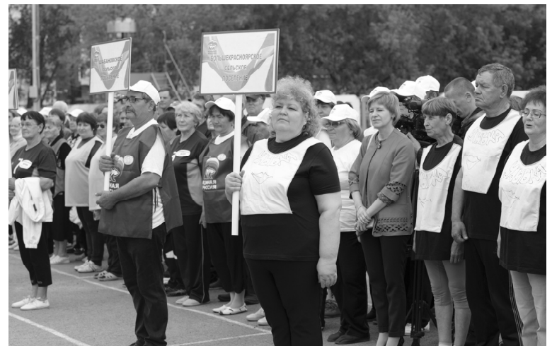
Торжественное построение команд