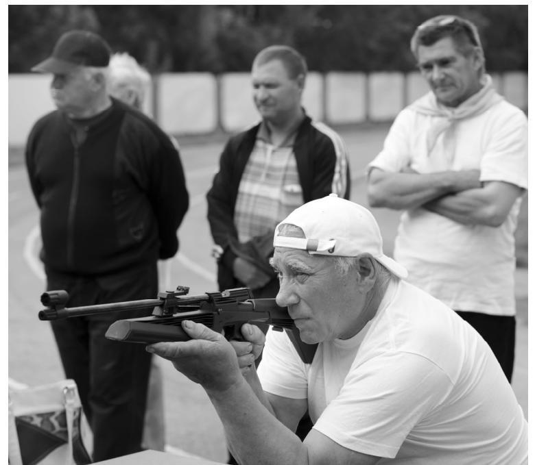
Выстрел в «десятку»