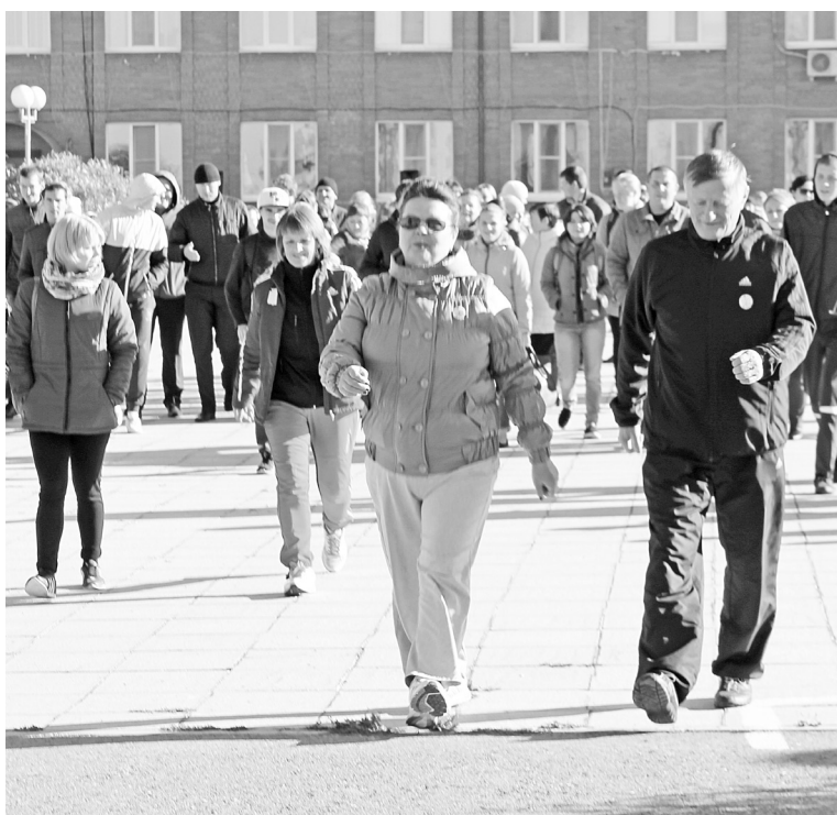
Среди марафонцев — и представители администрации района, и руководители учреждений. Всех объединяет спорт!