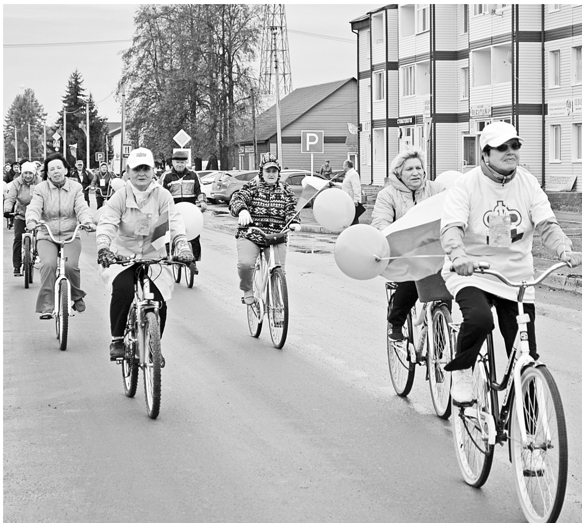
Счастливые, с хорошим настроением едут участники марафона. Хочется к ним присоединиться!