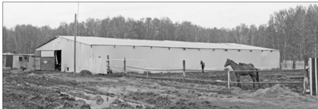
В крестьянском хозяйстве есть новая база для скота. Осталось построить подъездные пути