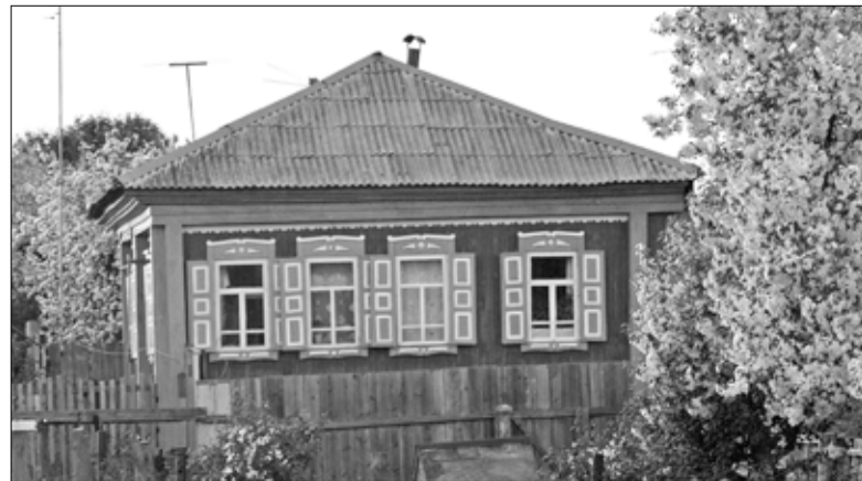
Старый дом Бакановых до сих пор стоит на пригорке села Королёво