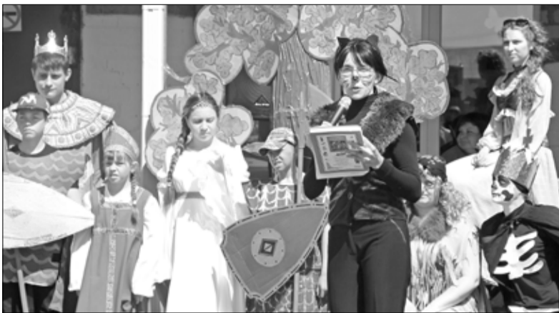
Кот учёный и герои пушкинских произведений открыли участникам волшебный мир сказок

Шестого июня, в день рождения русского поэта Александра Пушкина, в Земляновской школе прошёл сказочный марафон «Здравствуй, мир под названием Пушкин» – игра по сказкам поэта. На мероприятии собрались знатоки со всех отделений школы № 4, ребята из пришкольных лагерей. А провели, устроили детям настоящее увлекательное путешествие учителя и учащиеся школы, где уже много лет существует музей поэта, культурные организаторы сельского дома культуры, односельчане.