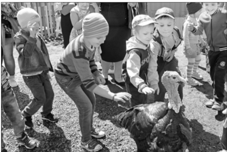
Самые эмоциональные и любопытные посетители агроусадьбы – дети

Агроусадьба «Планета животных» начиналась с простого подворья, на котором супруги Трофимовы разводили мелких животных и птицу. Увлечлись настолько, что в хозяйстве насчитывалось 25 пород кур, вьетнамские свиньи, породистые кролики, на мясо начали разводить нутрий. Гостеприимные хозяева открыли двери своего подворья по предложению благотворительного фонда «Наше время». Среди участников конкурса проектов «Культурная мозаика Голышмановского района» подворье Трофимовых отличается особой оригинальностью: контактный мини-зоопарк в нашем регионе – редкость. С тех пор «Планета животных» при-