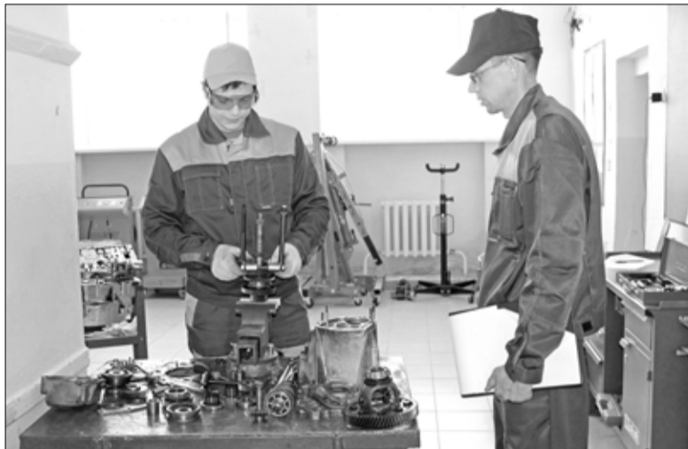
В Голышмановском агропедколледже – экзаменационная пора

В Голышмановском агропедагогическом колледже наступила пора государственной итоговой аттестации. В этом году экзамен в новом формате, который соответствует требованиям новых федеральных государственных образовательных стандартов, проходят двадцать обучающихся по профессии «Мастер по ремонту и