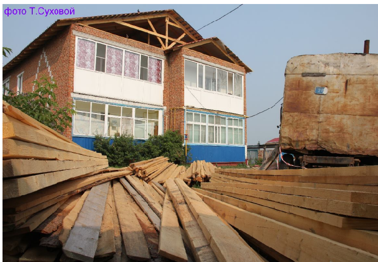
▶ С материалами для работы проблем нет.

На территории нашего района действует региональная программа капитального ремонта общего имущества многоквартирных домов. С 4 июля этого года в Викуловском районе начались такие работы. В число домов, попадающих под эту программу, вошли многоквартирные в с. Викулово, а также по одному дому в Балаганах, Коточигах и Поддубровном, всего к октябрю этого года (именно на этот месяц по календарю запланировано окончание работ) перед жителями района предстанут 18 обновлённых домов.