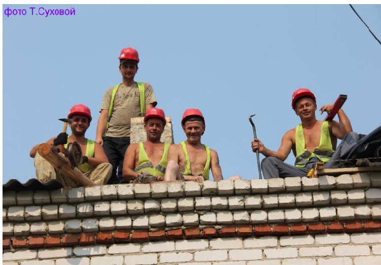
▶ Бригада рабочих на кровле крыши по ул. Ленина.