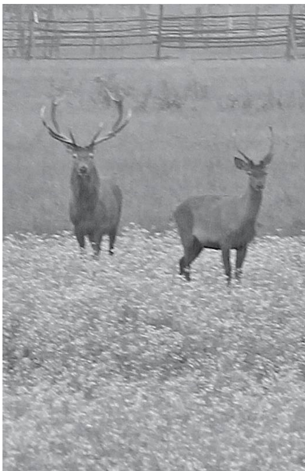
* Красавцы из сладковского леса.