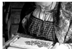
Пенсионеров готовы занять делом.

Уже 2 марта для пожилых тюменцев начнет действовать новый курс по вышиванию, который продлится шесть недель. Пенсионерам расскажут о рукодельном ремесле, научат техникам вышивки крестом, главью, ришелье и т.д. Напомним, что уже сейчас в университете третьего возраста, который действует на базе областного геронтологического