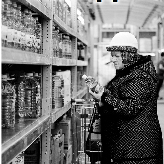
Жители области теперь еще пристальнее вглядываются в ценники.

раздают еду, срок годности которой подходит к концу. Задумывался проект как экологический - чтобы спасти планету от чрезмерного потребления и утилизации вполне пригодных товаров. А в России он приобрел социальное значение: нуждающиеся могут бесплатно пополнить запасы еды.