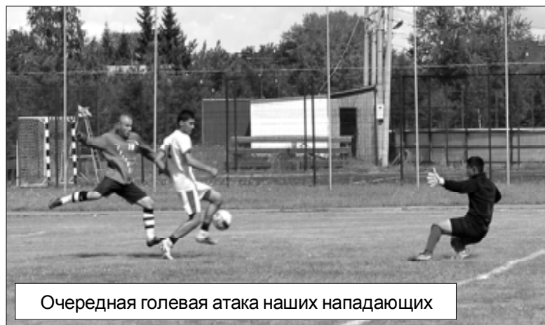
Очередная голевая атака наших нападающих

...Но мы-то ждали "принципиальную" встречу между голышмановцами и "Гранитом"! И наши футболисты смогли не просто порадовать, а заставить многочисленных болельщиков скандировать на