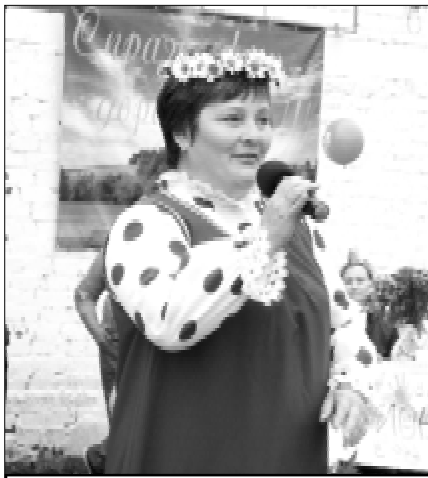
Глава поселения исполняет зажигательную песню