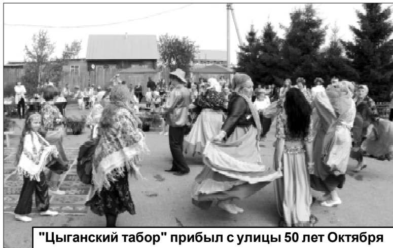
"Цыганский табор" прибыл с улицы 50 лет Октября