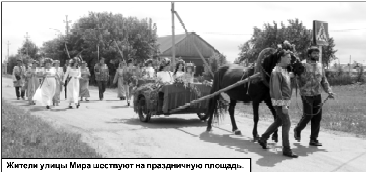
Жители улицы Мира шествуют на праздничную площадку.