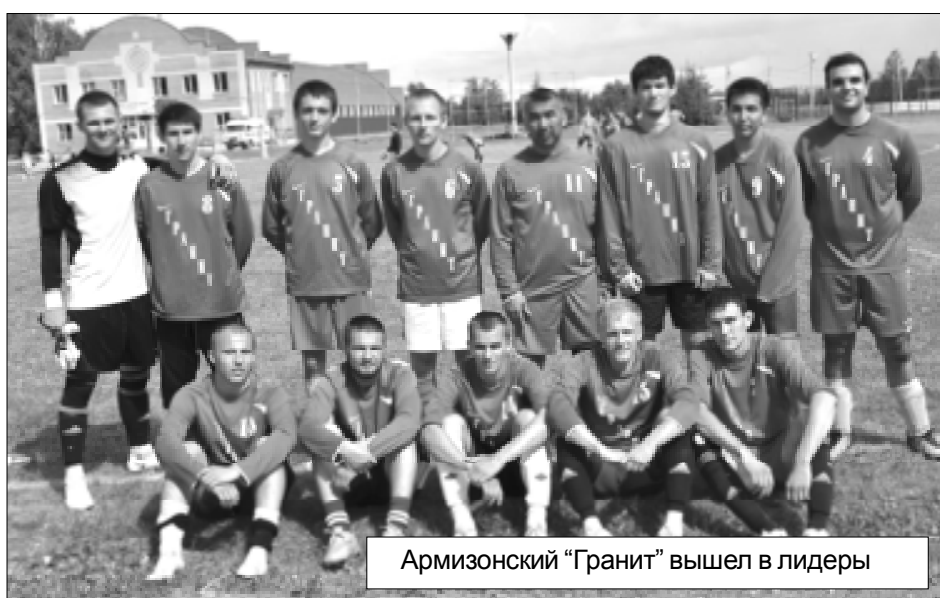
Армизонский "Гранит" вышел в лидеры

всю округу: "Молодцы! Молодцы!", поскольку смогли забить целых ШЕСТЬ мячей, так и оставив свои ворота "сухими"! Да... Такое стоило посмотреть!