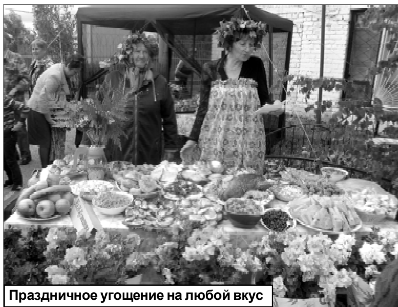
Праздничное угощение на любой вкус