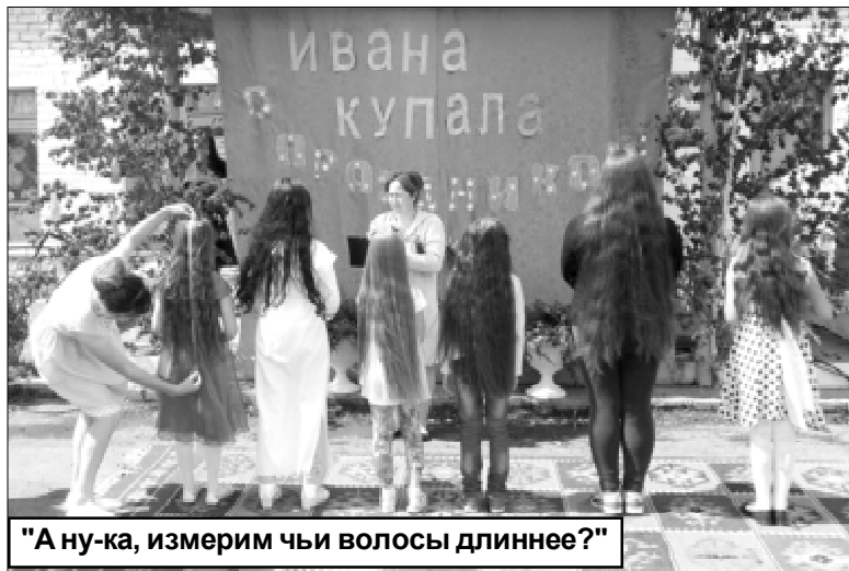
"А ну-ка, измерим чьи волосы длиннее?"

В селе Иваново всего 7 улиц, и каждую представляли по-особому – оригинально. Молодцы! Фантазии не было предела! В защиту входила «визитка», творческий номер, конкурс «Варвара-краса длинная коса» и... оформление индивидуаль-