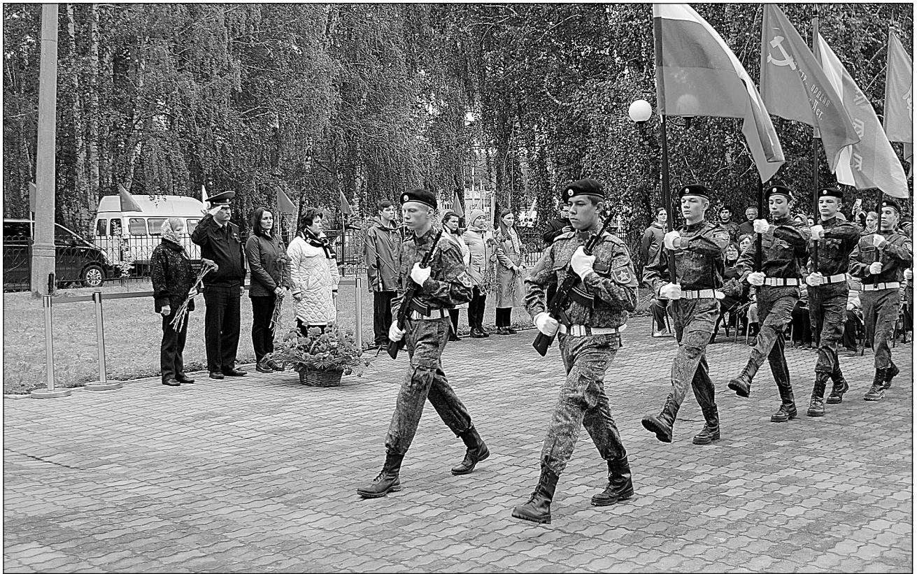
Торжественное мероприятие на площади поселка Новотарманский.