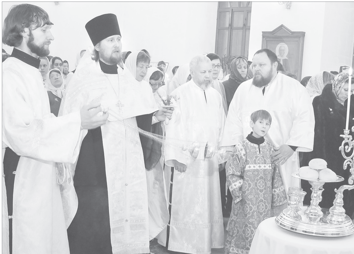
«Рождество твоё, Христе Боже наш, озарило мир светом знания...»