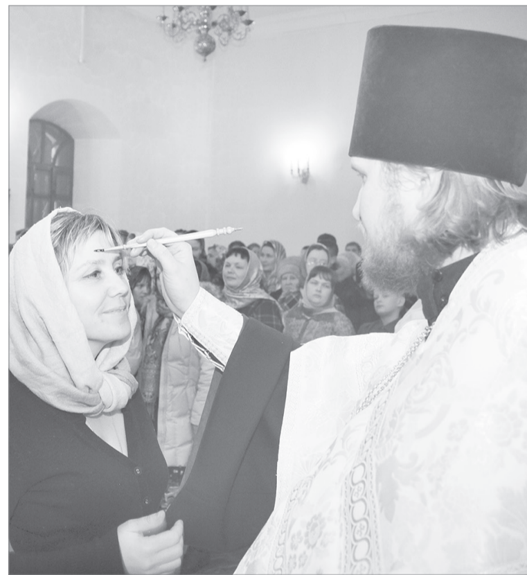
Помазание - символ Божией милости и благословения

Особенно радовалась детвора, ведь парк накануне Нового года превратился в снежный городок, где построена крепостная стена, фигурки военной техники, отличная ледяная горка. Румяные