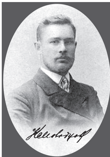
Депутат К.И. Молодцов. 1907–1912 гг.

1 июня 2023 года исполняется 150 лет со дня рождения Константина Ивановича Молодцова, уроженца Ишимского уезда, члена Государственной думы III созыва.