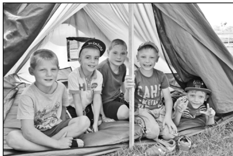
В палатке на территории школы можно почувствовать себя настоящим туристом

На многопрофильном слёте «Страна чудес» побывали 35 детей от 10 до 18 лет. Пять дней в палатках на свежем воздухе смогли провести не только казанские ребята. Школьники приехали из отдалённых деревень: Новогеоргиевски, Вознесенки, Грачей. Некоторые из них прибыли отдохнуть к бабушкам из разных городов. Погода в эти дни простояла прекрасная, поэтому настроение у всех было отличное. Каждый день у подростков был насыщенный активными видами деятельности. Так, например, один из них был посвящён туризму, в другой день была организована игра на местности «Выживание».