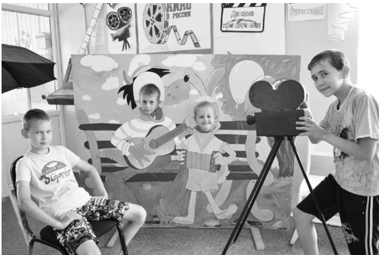
Игровая съёмка фильма в Казанской школе

В Казанской школе три смены летнего лагеря с дневным пребыванием детей прошли под названием «Внимание, снимаем кино!». Все без исключения отряды были своеобразными киностудиями, кото-