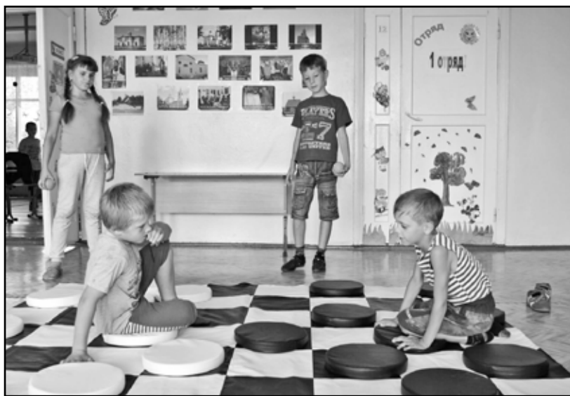
В Новоселезнёвской школе дети играют в напольные шашки