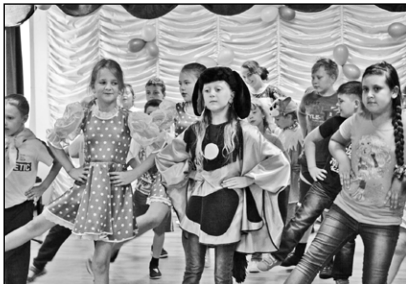
Танцевальный номер в одной из концертно-игровых программ ДШИ

ние в лесу». В «День кино» мальчишки и девчонки получили уроки актёрского мастерства и снимали фильмы по собственному сценарию на мобильные телефоны, а затем в палатке-ангаре, объединённом с импровизированной сценой, просматривали их после обработки и монтажа на большом экране.