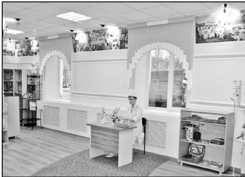
Основной зал музея здравоохранения