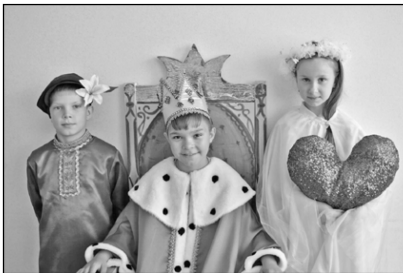
Воспитанники театральной студии детской школы искусств