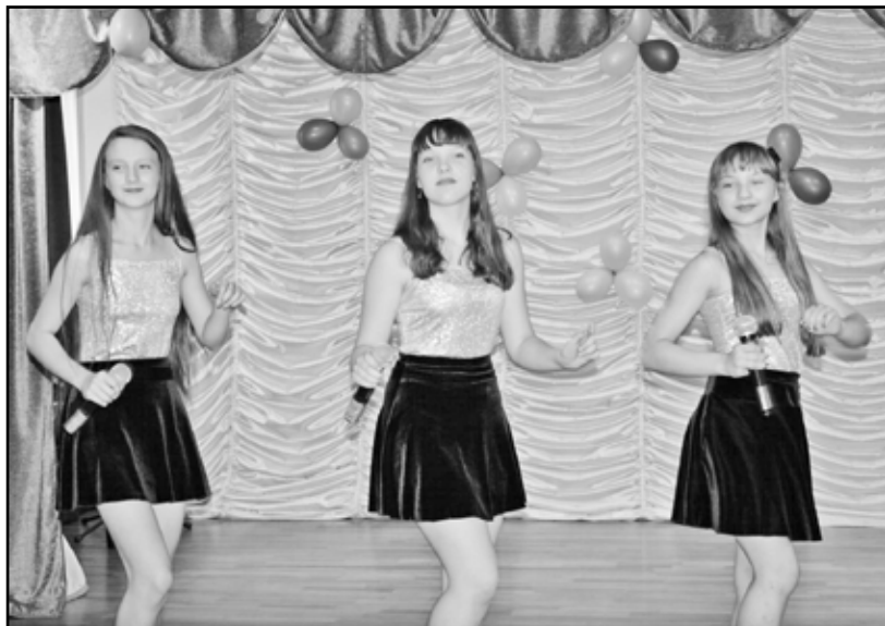
Вокальная группа «Незабудки» – украшение любого мероприятия

рые снимали фильмы из жизни своей команды. В каждой игровой комнате красовалась своя «кинолента», состоящая из фотографий, рисунков и интересных заметок, отражающих ежедневную жизнь отряда. В конце смены из маленьких сюжетов монтировался фильм о жизни всего лагеря.