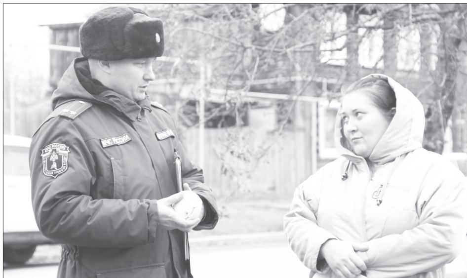
Автономный датчик дыма, который стоит примерно 600 рублей, вполне может спасти вашу жизнь и имущество

Особое внимание пожарные уделяют деревянным многоквартирным домам. На одной только улице Шаурова в историческом центре города их добрый десяток. Некоторые уже горели несколько лет назад. А в целом в Ялуторовске таких деревянных строений, по данным МЧС, около 80. Как правило, в них пара подъездов и два этажа. Отопление там может быть централизованным, газовым, электрическим или печным. По-разному. И жильцы тоже разные. С местными жителями беседуют и вручают им памятки по безопасно-