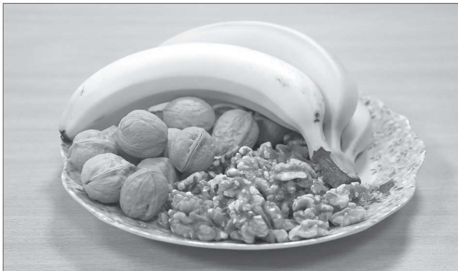
Бананы и орехи отлично сочетаются. Такой перекус в небольшом объёме заряжает энергией

2. Бананы. Хороший вариант перекуса - сладкие на вкус, они имеют средний гликемический индекс. В бананах много клетчатки, улучшающей пищеварение, витаминов С, Е, группы В и минералов: кремния, магния, кальция, железа и других. Бананы укрепляют стенки сосудов, снижают риск появления гипертонии и инсульта, улуч-