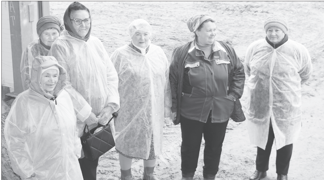
Гостям сельхозпредприятия устроили экскурсию по новым коровникам и телятникам, показали современное техническое оснащение