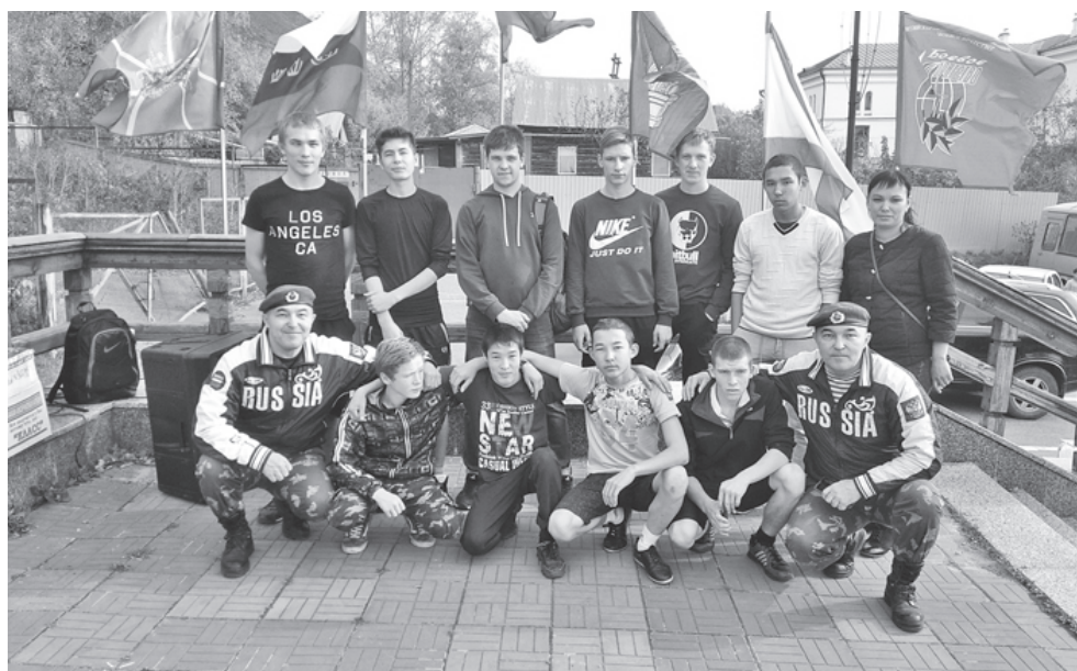
На снимках: команда «Стрела»; спортсмены Вагайского отделения ТМТ.