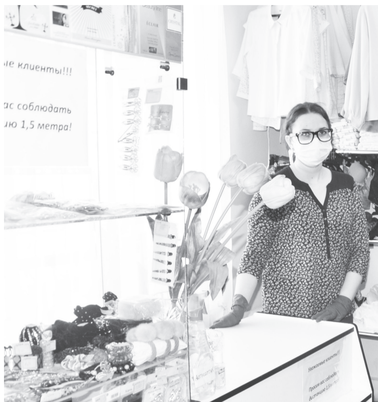
«Дамский каприз» ждёт покупателей.

«Когда из-за угрозы распространения нового вируса ввели режим «сидим дома», один из магазинов был закрыт. В «Радуге» есть продукты, поэтому запрет на торговлю его не коснулся, он выручил не только нашу семью, осталась хоть какая-то прибыль, но и односельчан», – рассказала бизнесмен. По её словам, многие пришли в это время в торговую точку впервые. Здесь есть одежда, посуда, хозяйственные товары, которые в условиях режима