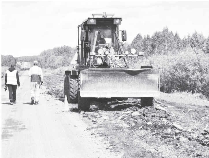
Дорожники готовят участок для нового асфальта.