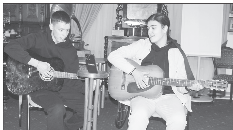
Душевно, с песнями под гитару и разговорами прошёл квартирник «Осень шепчет за окном...»