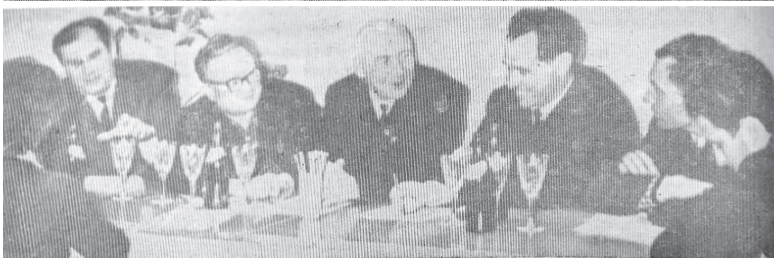
Праздничный номер от 7 ноября 1967 года получился насыщенным. В нём можно прочесть о ровеснике революции, строительстве «Юбилейного», встрече в редакции и многом другом