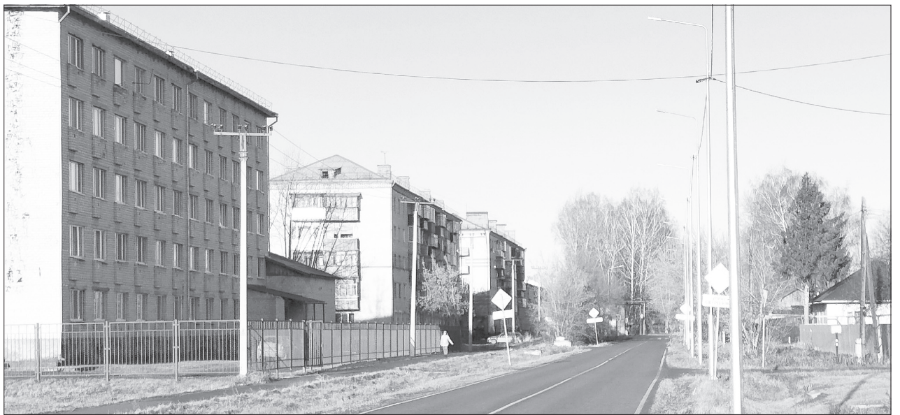
Опоры уличного освещения установили на нечётной стороне проезжей части дороги - напротив двух пятиэтажек