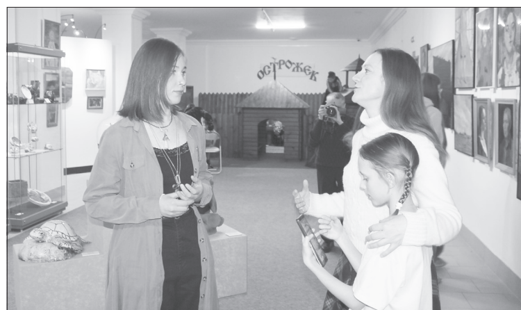
На открытии выставки «Палитра красок» можно было пообщаться с самими авторами работ