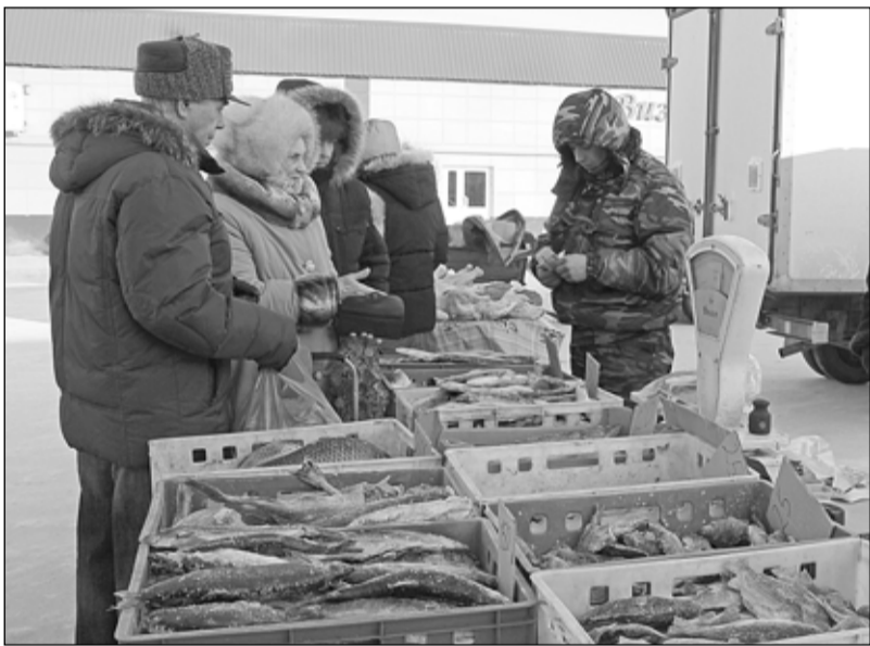
Спросом пользовалась свежемороженая рыба