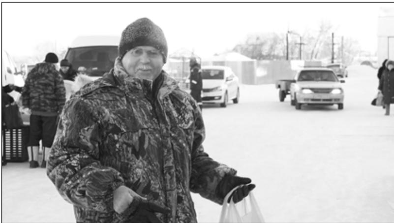
Покупатели уходили с ярмарки не с пустыми руками