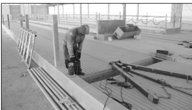
Строительство продолжается в любую погоду

Наталья ГЛАДКОВСКАЯ.