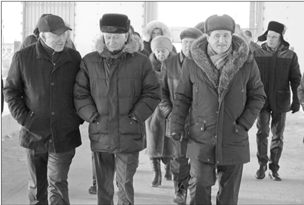
Глава района с депутатами в «Дамате»