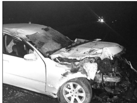
От нарушения правил до беды – один шаг

Надежда ЧЕРЕПАНОВА.