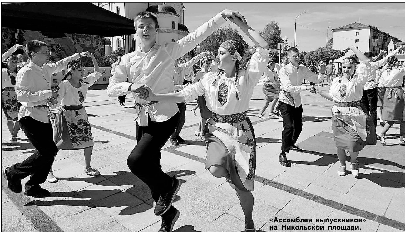
«Ассамблея выпускников» на Никольской площади.