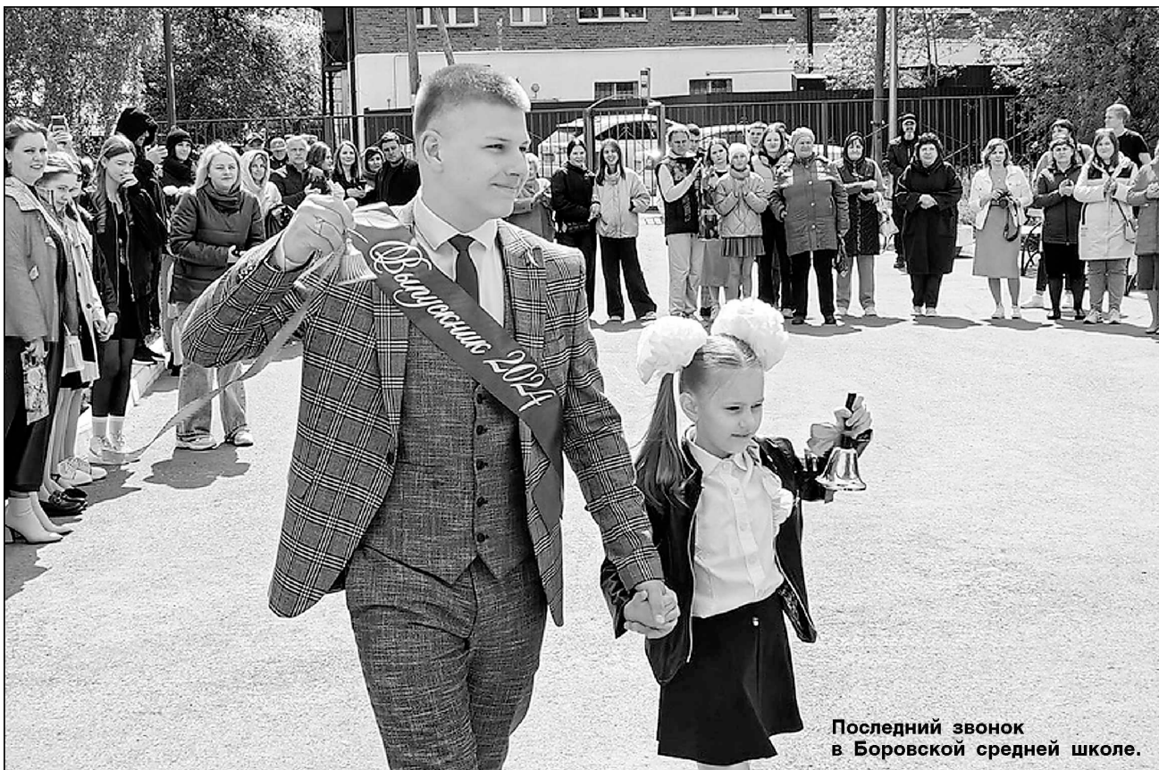
Последний звонок в Боровской средней школе.