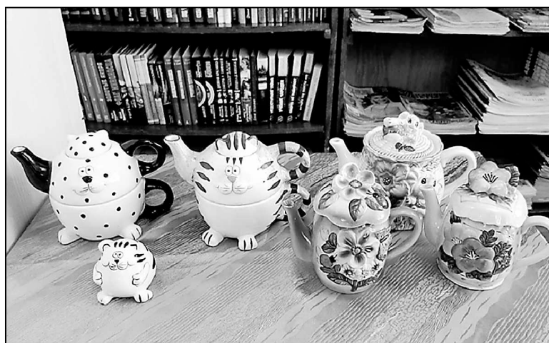
Семья чайников-кошек и семья чайников-цветов.

Они дополняют информацию обо всем сказанном. Ведь все, что полезно, то прекрасно!