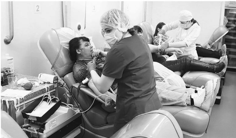
Всего в днях донора в марте поучаствовали около 350 жителей нашего округа

29 марта. 10 часов дня, внутренний двор больницы в посёлке Голышманово. Здесь, перед фургоном передвижного комплекса Тюменской областной станции переливания крови, скопилась живая очередь с два десятка человек.