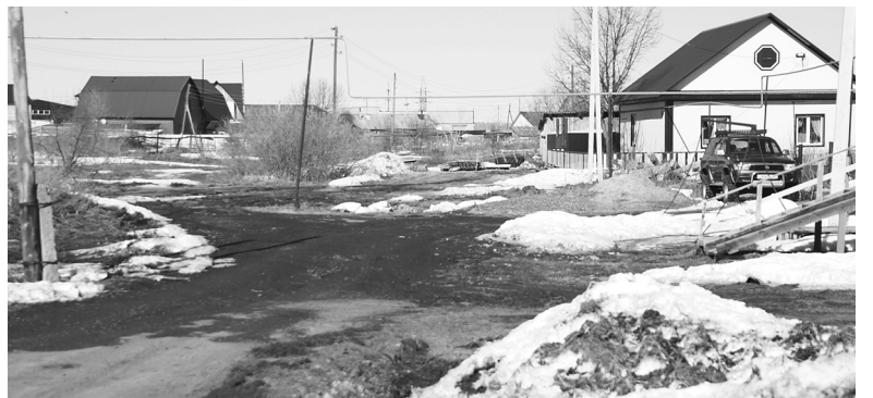
Тот самый непроезжий тупик в конце улицы Мелиораторов в посёлке Голышманово

«На улице Мелиораторов я живу 23 года. Много лет назад её благоустроили: уложили железобетонные плиты на дорогу. Вот только возле трёх домов – с номера 31 по 35-й, в котором я живу – не оказалось дорожного полотна. Мне 65 лет, здоровье слабое, приходится часто вызывать «скорую», а к нам доехать проблематично. В распутицу машина останавливается на асфальте, а дальше фельдшер кое-как пробирается через ямы, грязь и колеи. Хочу через газету спросить, когда отремонтируют оставшийся участок дороги на нашей улице. Хоть бы немного подсыпали щебня или прогрейдировали.»