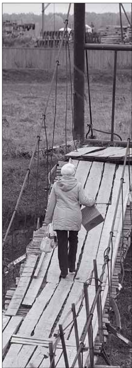
Жители села Голышманово обеспокоены ветхостью пешеходного моста. Капремонт не будет – местная власть поддерживает переходы в пригодном состоянии