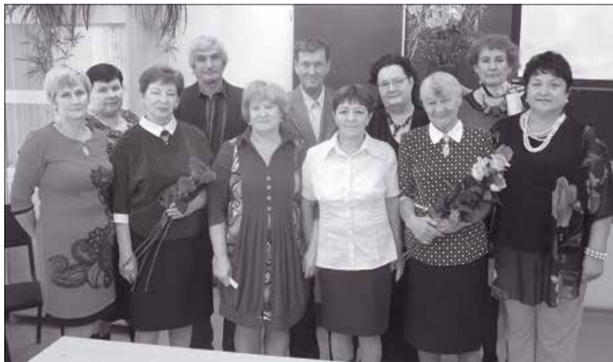
Земляновские выпускники 1976 года собрались на встречу с учителями