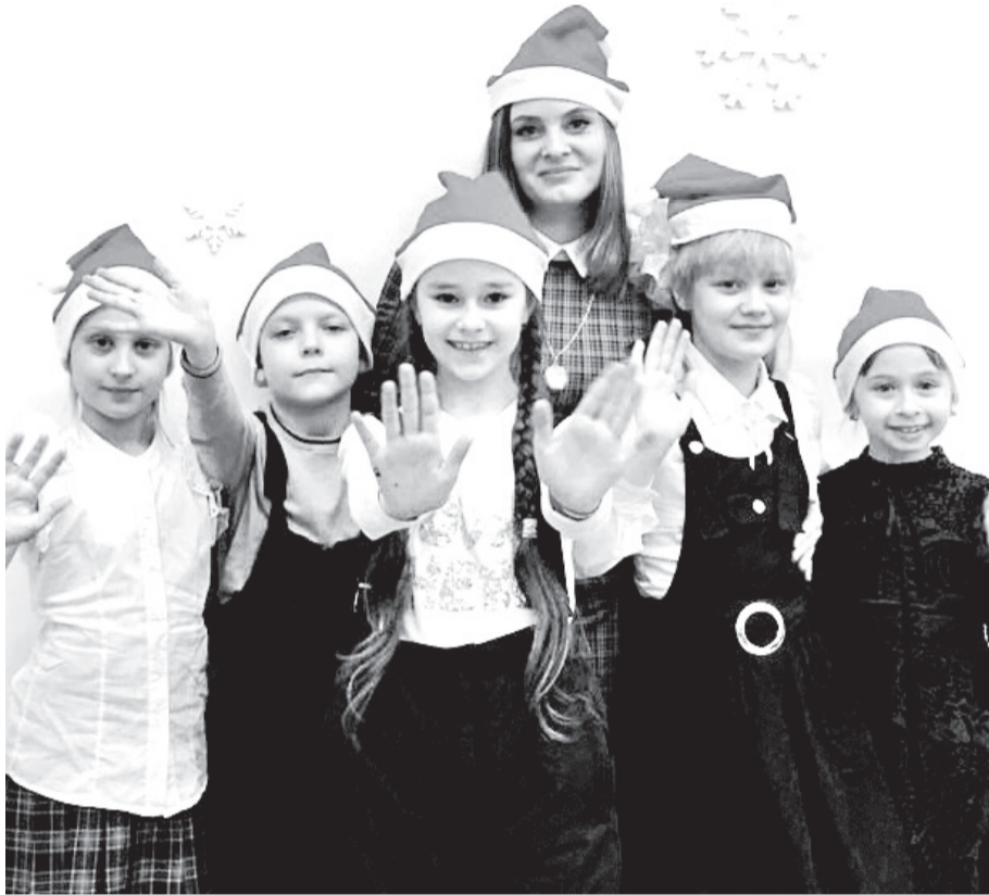
• В школе «Гринвич» рождественское настроение.

В школе английского языка «Гринвич» в Заводоуковске сформированы первые группы. Сегодня здесь занимаются два десятка мальчишек и девчонок.