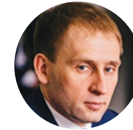
КОЗЛОВ А.А. МИНИСТР ПО РАЗВИТИЮ ДАЛЬНЕГО ВОСТОКА