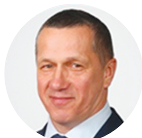
ТРУТНЕВ Ю.П. ВИЦЕ-ПРЕМЬЕР