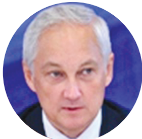
БЕЛОУСОВ А.Р. ПЕРВЫЙ ВИЦЕ-ПРЕМЬЕР