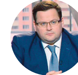
КОТЯКОВ А.О. МИНИСТР ТРУДА