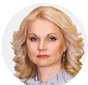
ГОЛИКОВА Т.А. ВИЦЕ-ПРЕМЬЕР