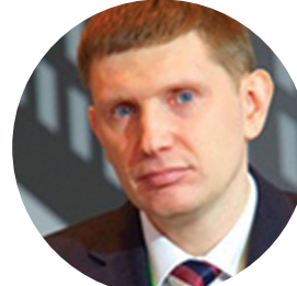
РЕШЕТНИКОВ М.Г. МИНИСТР ЭКОНОМИЧЕСКОГО РАЗВИТИЯ