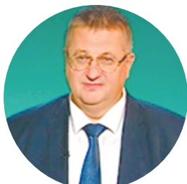
ОВЕРЧУК А.Л. ВИЦЕ-ПРЕМЬЕР