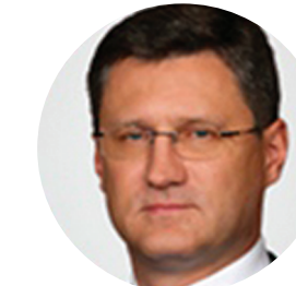
НОВАК А.В. МИНИСТР ЭНЕРГЕТИКИ