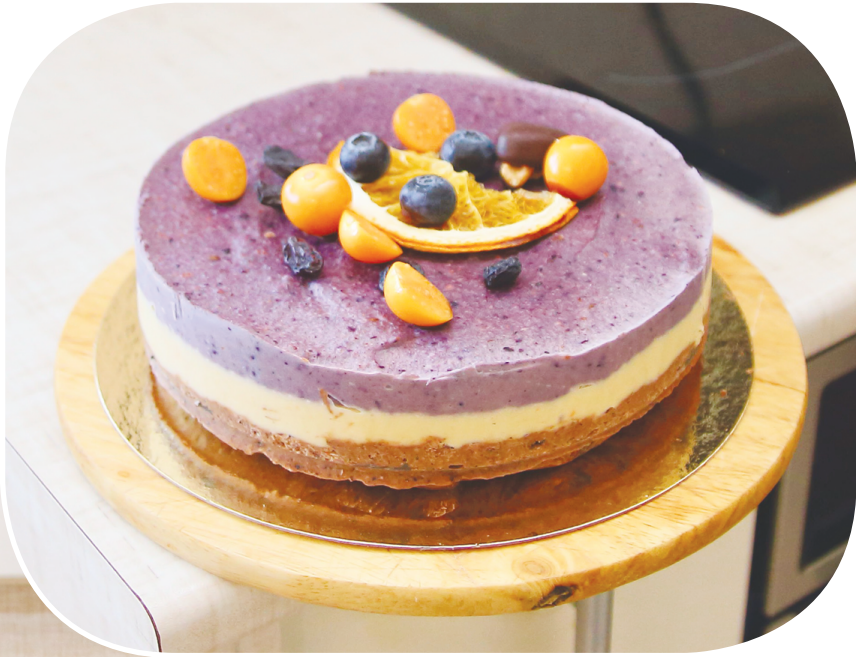
В чернично-апельсиновом торте ни грамма сахара

домашней кухне, стало обладателем гранта конкурса социальных предпринимательских проектов «PROгород» от компании СИБУР. Думаю, что не только социальная составляющая её концепции тронула строгое жюри, но и вкус пирожных не оставил никого равнодушным. На грантовые средства молодой кондитер и предприниматель приобрела дорогостоящий блендер с большой мощностью, который ускоряет процесс измельчения цельных сырых ингредиентов до нескольких секунд.