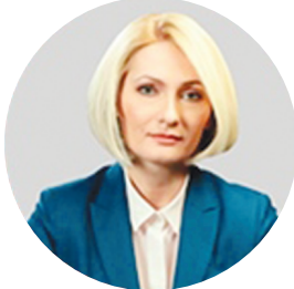
АБРАМЧЕНКО В.В. ВИЦЕ-ПРЕМЬЕР