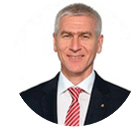
МАТЫШИН О.В. МИНИСТР СПОРТА