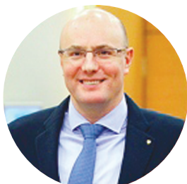
ЧЕРНЫШЕНКО Д.Н. ВИЦЕ-ПРЕМЬЕР