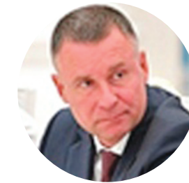
ЗИНИЧЕВ Е.Н. МИНИСТР ПО ДЕЛАМ ГО И ЧС