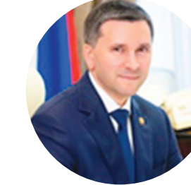
КОБЫЛКИН Д.Н. МИНИСТР ПРИРОДЫ