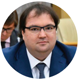
ШАДАЕВ М.И. МИНИСТР ЦИФРОВОГО РАЗВИТИЯ