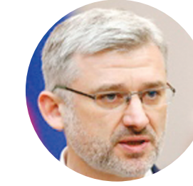
ДИТРИХ Е.И. МИНИСТР ТРАНСПОРТА