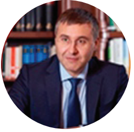
ФАЛЬКОВ В.Н. МИНИСТР НАУКИ И ВЫСШЕГО ОБРАЗОВАНИЯ