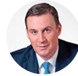
ПАТРУШЕВ Д.Н. МИНИСТР СЕЛЬСКОГО ХОЗЯЙСТВА