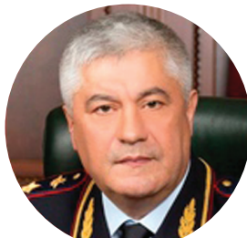
КОЛОКОЛЬЦЕВ В.А. МИНИСТР ВНУТРЕННИХ ДЕЛ