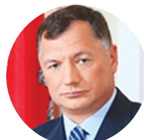
ХУСНУЛЛИН М.Ш. ВИЦЕ-ПРЕМЬЕР