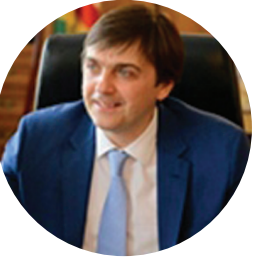
КРАВЦОВ С.С. МИНИСТР ПРОСВЕЩЕНИЯ