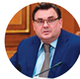
ЧУЙЧЕНКО К.А. МИНИСТР ЮСТИЦИИ