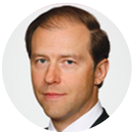
МАНТУРОВ Д.В. МИНИСТР ПРОМЫШЛЕННОСТИ И ТОРГОВЛИ