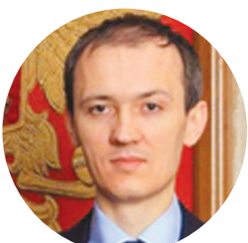
ГРИГОРЕНКО Д.Ю. ВИЦЕ-ПРЕМЬЕР