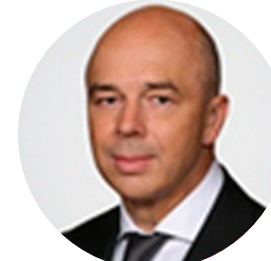
СИЛУАНОВ А.Г. МИНИСТР ФИНАНСОВ