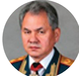
ШОЙГУ С.К. МИНИСТР ОБОРОНЫ