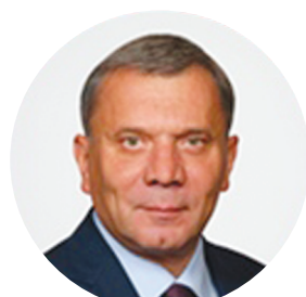
БОРИСОВ Ю.И. ВИЦЕ-ПРЕМЬЕР