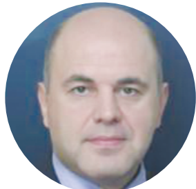
МИХАИЛ МИШУСТИН ПРЕДСЕДАТЕЛЬ ПРАВИТЕЛЬСТВА

В его составе теперь двое тюменцев: сохранил свой пост министр строительства и ЖКХ Владимир Якушев (экс-губернатор нашего региона), а бывший ректор ТюмГУ Валерий Фальков занял пост министра науки и высшего образования.