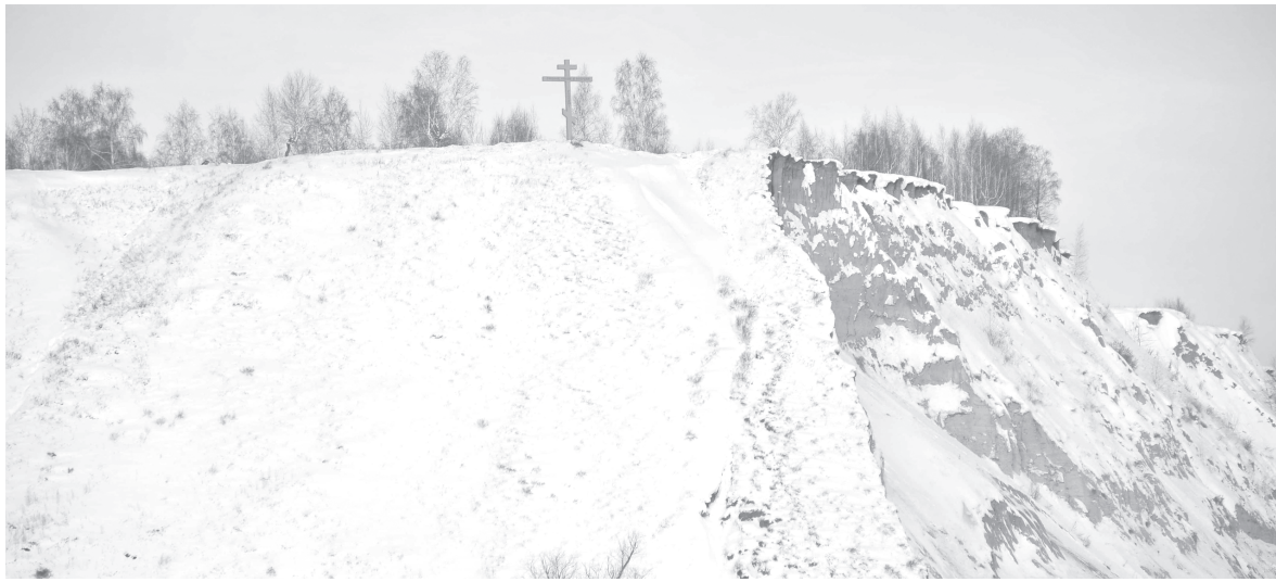
Чувашский мыс – место, откуда есть пошёл Тобольск