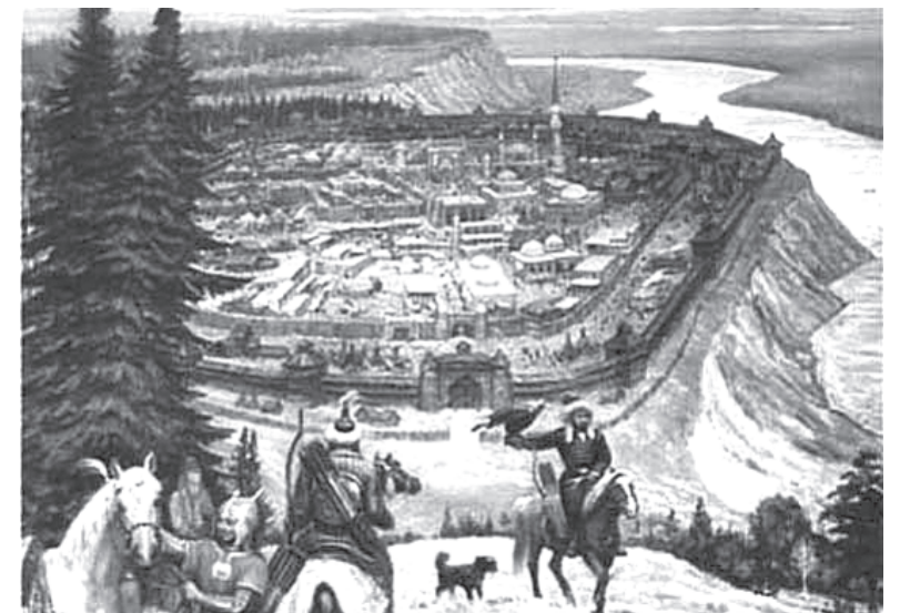
Искер – он же Сибирь, он же Кашлык

Много споров идет о местности «Подчуваша» и «Чувашском мысе», большая часть которой смыта в реку. Мыс же называется «Патша баш», что дословно означает «голова правителя» – имеющий смысл как центр царства. Действительно, это, пожалуй, самое колоритное и красивое место вокруг Тобольска. Мыс как бы представляет голову, то есть начало, от которой по обе стороны тянутся плечи и руки человека или крылья птицы. Схожесть слов патшабаш и подчуваша придала этимологическую загадку для исследователей. Ну, если местность под мысом называется Подчуваша, то сам мыс должен быть чувашским, где, вероятно, был город, и там, якобы, жили чуваша. Одинаковость звучания этих слов со временем привели к неверным историче-