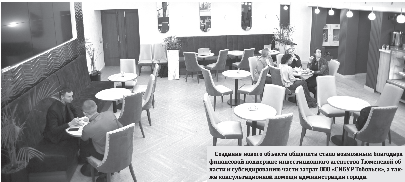
Создание нового объекта общепита стало возможным благодаря финансовой поддержке инвестиционного агентства Тюменской области и субсидированию части затрат ООО «СИБУР Тобольск», а также консультационной помощи администрации города.