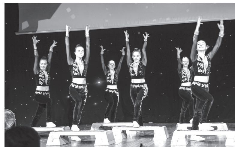
Новинка программы – номер со степ-платформами