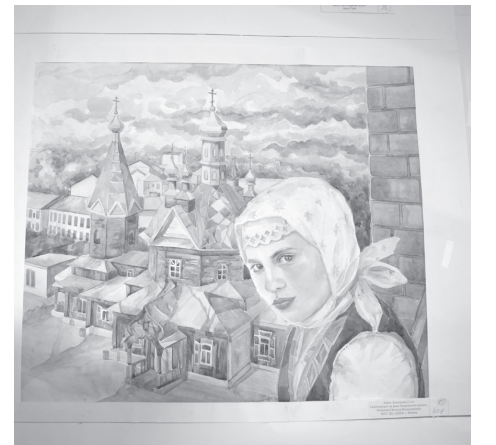
Автопортрет из Ишима

– Мы и не подозревали, когда 25 лет назад задумывали этот проект, что он