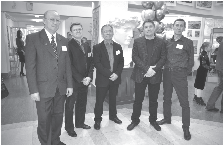
Награды получил весь коллектив ДШИ

В этом году на конкурс поступило 133 заявки от 129 образовательных учреждений. В выставке участвует более 1600 работ учащихся художественных школ, школ искусств, студий, профильных вузов из 94 городов РФ и 17 зарубежных образовательных учреждений. География российских участников обширна: охвачена практически вся территория, за исключением Дальнего Востока. Свои работы на выставку-конкурс представили юные художники со всей России: от Тюменской области до Астраханской и Архангельской областей, от Красно-