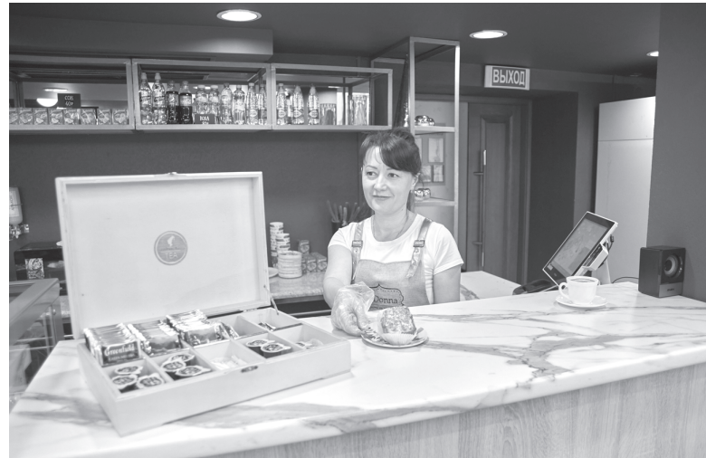
В кафе создано восемь новых рабочих мест