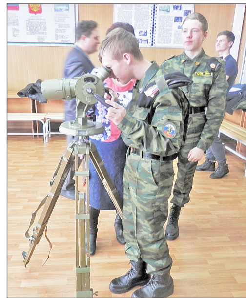
Ребята с интересом рассматривали окрестности села через зенитную командирскую трубу

сотрудники пограничной службы, руководители и юноши специализированных групп, педагоги, представители общественной организации – были солидарны в том, что слёт нужно проводить ежегодно и при большом количестве участников.