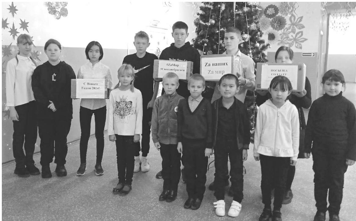
Мелехинские ребята приняли участие в сборе посылок для наших солдат