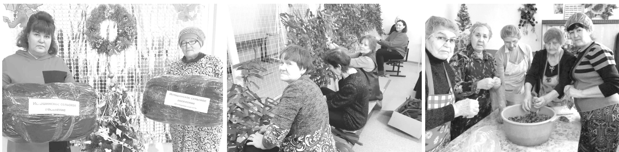
Волонтеры Истошино, Полозаозерья и Старорямово. Каждый вносит вклад в общее, доброе дело