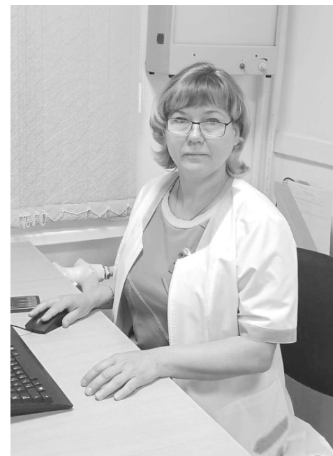
Врач рекомендует для профилактики: здоровый образ жизни и физические нагрузки

Рецидив - это возвращение болезни после пройденного курса лечения и ремиссии. Спрогнозировать на 100 % произойдет ли рецидив - трудно. Конечно же, чем раньше диагностирована болезнь и начато лечение, тем ниже шансы рецидива в будущем. В целом, вероятность