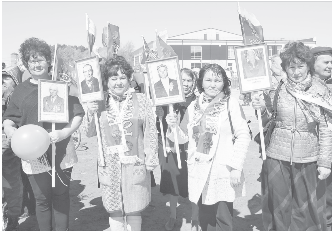
С героями «Бессмертного полка»