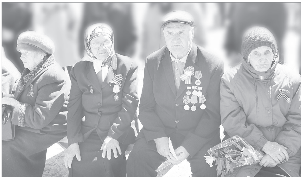
Ковали Победу в тылу