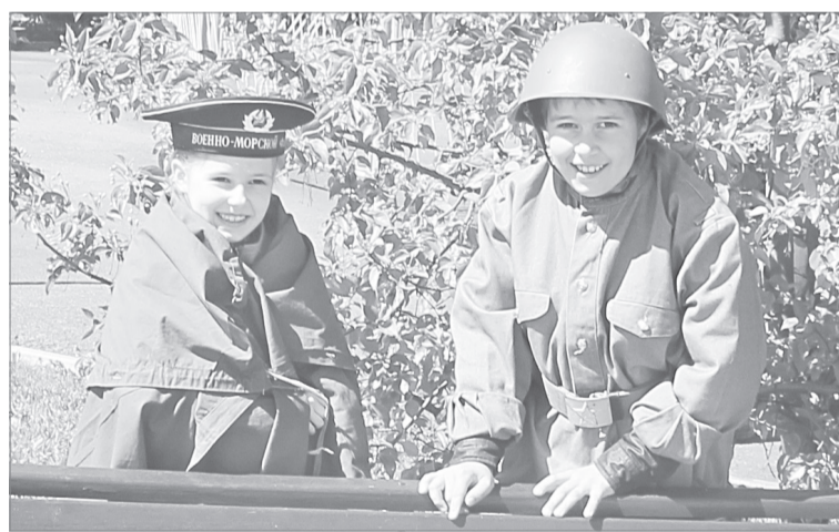
«Ощутили силу героев!»

Стоит отметить, что сейчас создаётся одноимённый региональный интернет-портал, на