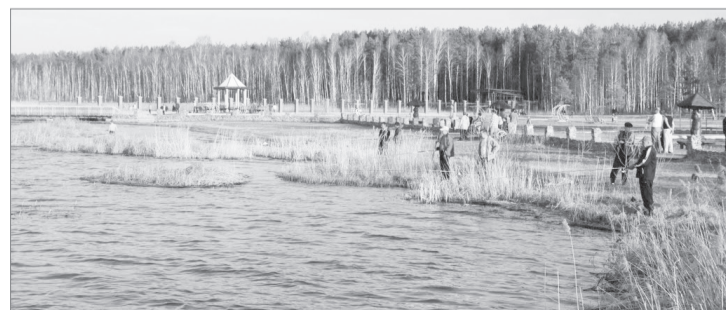
На озере Малый Тараскуль

Никому рассказывать об увиденном в ту ночь я не стал, боялся, что не поверят, засмеют. Да и зачем было пугать тех, кому идти на дежурство только предстоит. И они потом не говорили ни слова ни о каких призраках. Я подумал, что видения в ночном детском саду померещились из-за моей усталости на основной работе. А сейчас решил поведать о тех кошмарах в связи с тем, что в телевизионных передачах и других средствах массовой информации часто рассказывают о паранормальных явлениях. Много ещё непознанного рядом с нами. Но ведь это вовсе не значит, что всё, что не может пока объяснить наука, не существует.