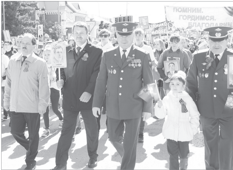
В одном строю