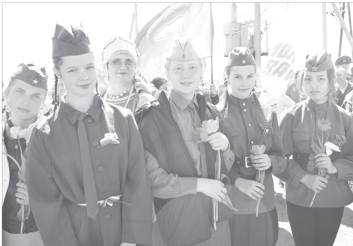
Военная форма - специально к параду

Но вернёмся на площадь... Детвора и взрослые с удовольствием участвовали в военизированных забавах. В «медсанчасти» оказывали первую помощь и не забывали угостить витаминами. В «прифронтовом салоне» все желающие могли