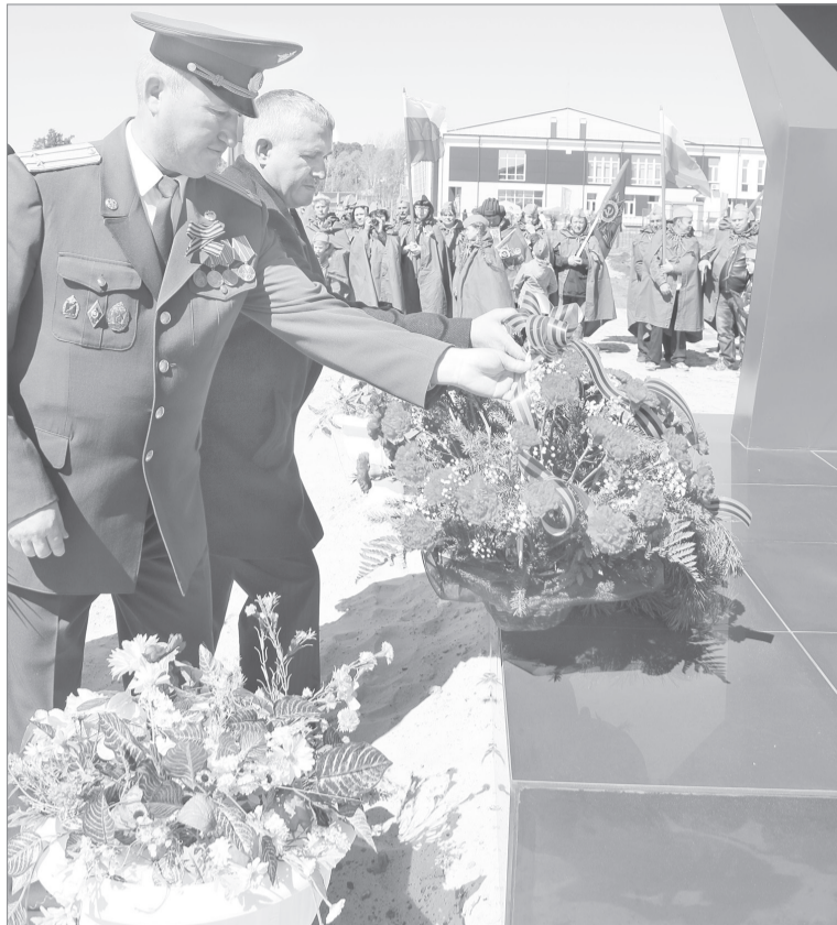
Цветы к мемориалу