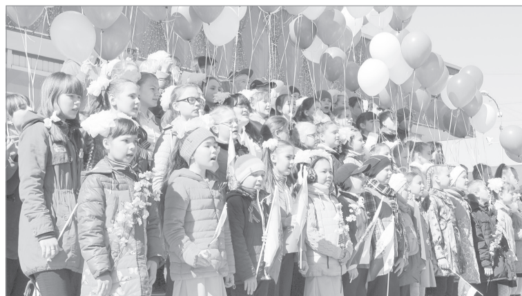
«... этот День Победы!»

который можно будет загрузить фото ветерана, не выходя из дома. В данный момент отрабатываются вопросы информационной безопасности, достоверности публикуемых данных и удобного контекстного поиска.