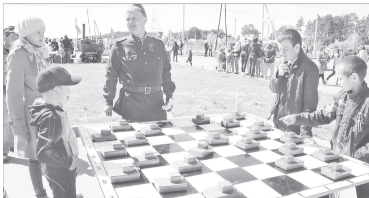
На поле боя - юные «танкисты»