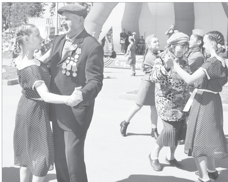
В вихре майского вальса