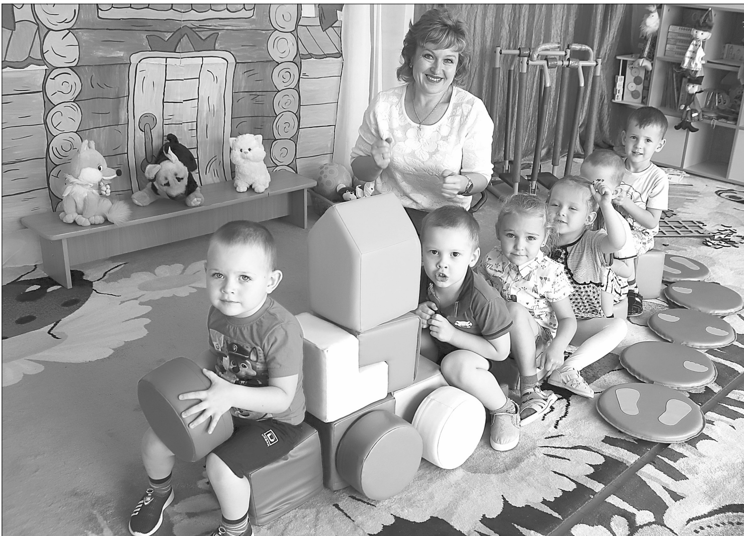
Старший воспитатель и сейчас находит минутку, чтобы поиграть с детьми