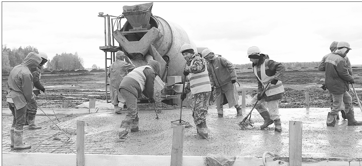
Рабочие заливают бетоном парковку площадью 4000 квадратных метров