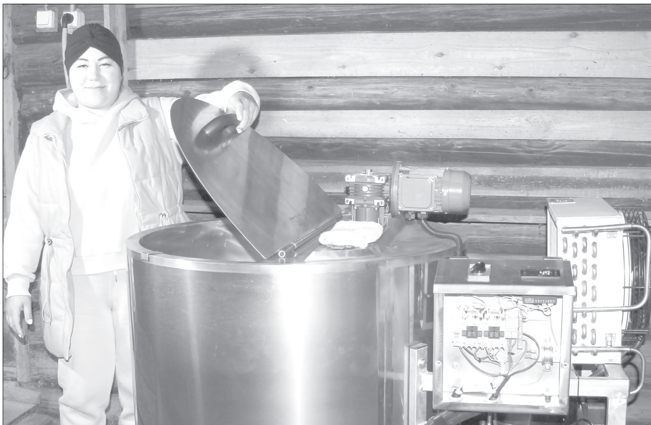
В Аслане агрегат на 300 литров уже смонтирован и работает в автоматическом режиме

Личные подсобные хозяйства бесплатно получают охладители