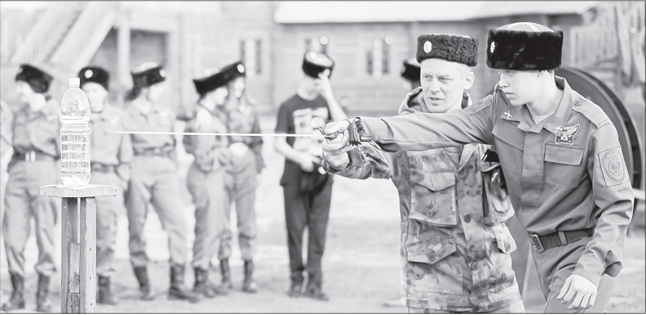
Одна из главных целей у юных казаков - научиться мастерски владеть шашкой

Научиться и зарабатывать. В рамках программы летней занятости не-