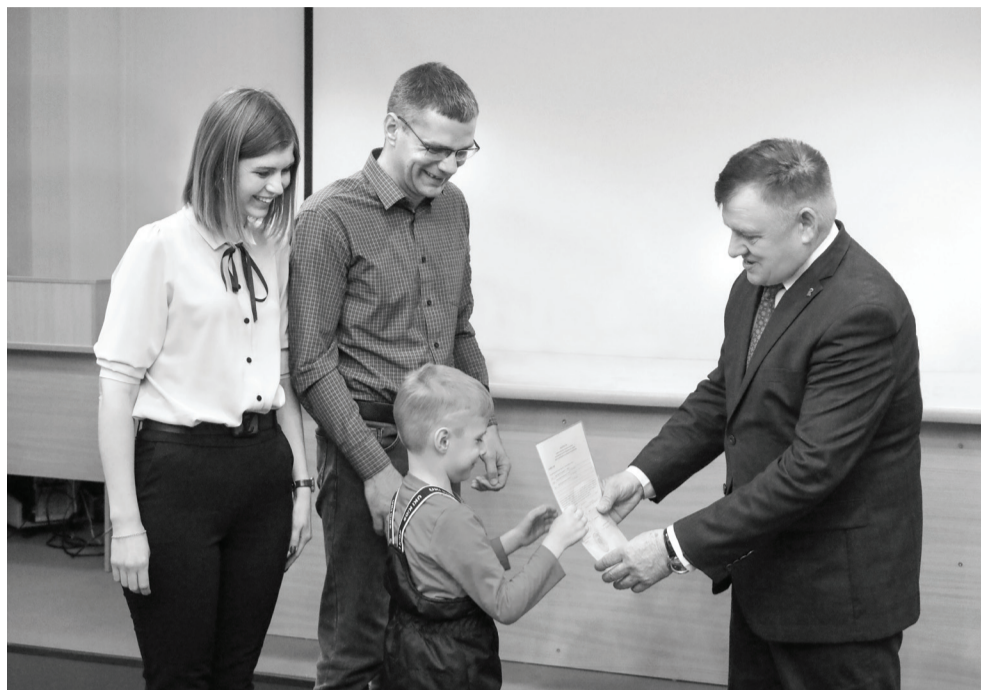
В приоритетном порядке получают господдержку по программе многодетные семьи.