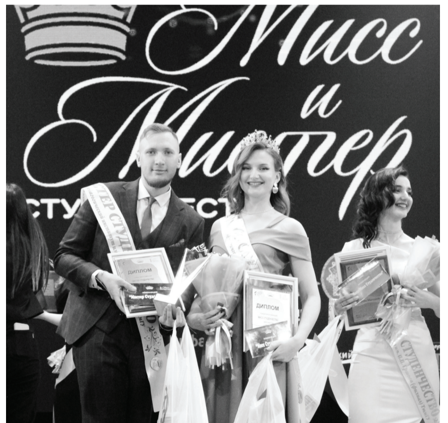
// Фото предоставлено Сабиной АМРЕНОВОЙ.