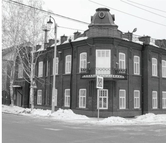
Военный комиссариат – лицо города и Вооруженных Сил Российской Федерации, важно создать достойные условия для будущих защитников Отечества.

Военкомат в нашем городе был организован в 1919 году. В те времена, помимо работы с красноармейцами,