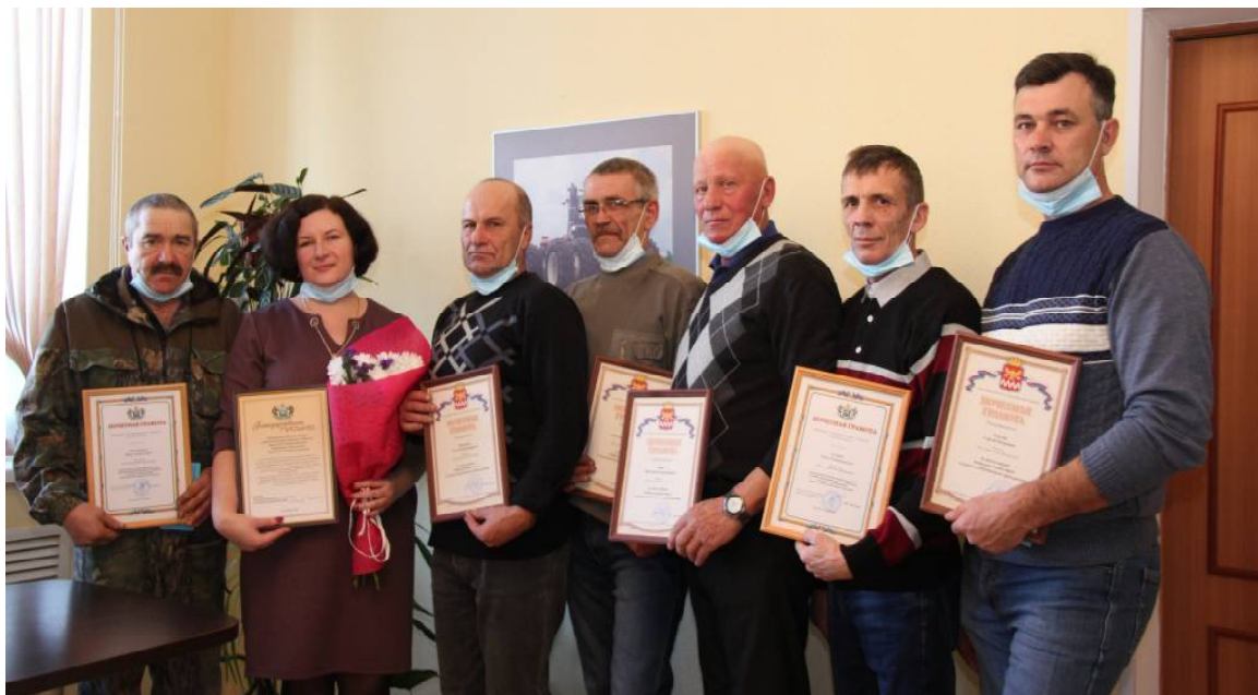
➤ Награждение передовиков в АК «Викуловский»

Отдел социальной защиты Викуловского района