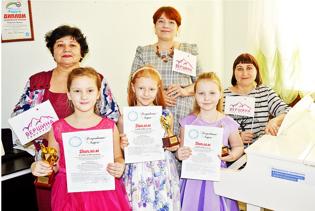
Лауреаты конкурса разделили радость со своими педагогами