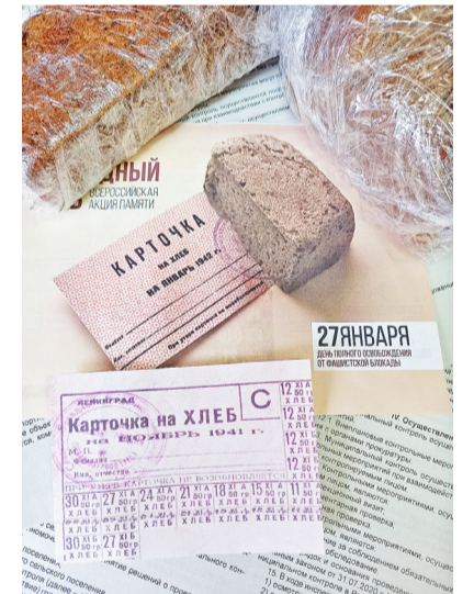
Такие 125 граммов блокадного хлеба выдавали по карточкам