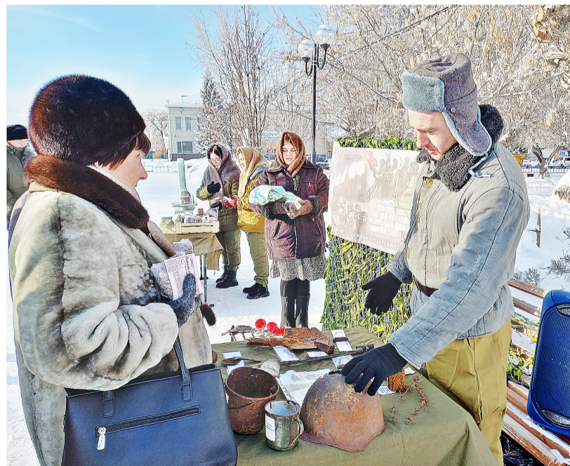
Передвижная выставка привлекала внимание прохожих

Основные ингредиенты блокадного хлеба – подсолнечный жмых и пищевая целлюлоза. Жмых – это отходы маслобойного производства, семечки, раздавленные вместе с кожурой. И чем дольше продолжалась блокада, тем меньше на складах оставалось муки, тем больше жмыха и целлюлозы приходилось добавлять в хлеб. Остальные компоненты хлеба были прежними: закваска, соль и вода.