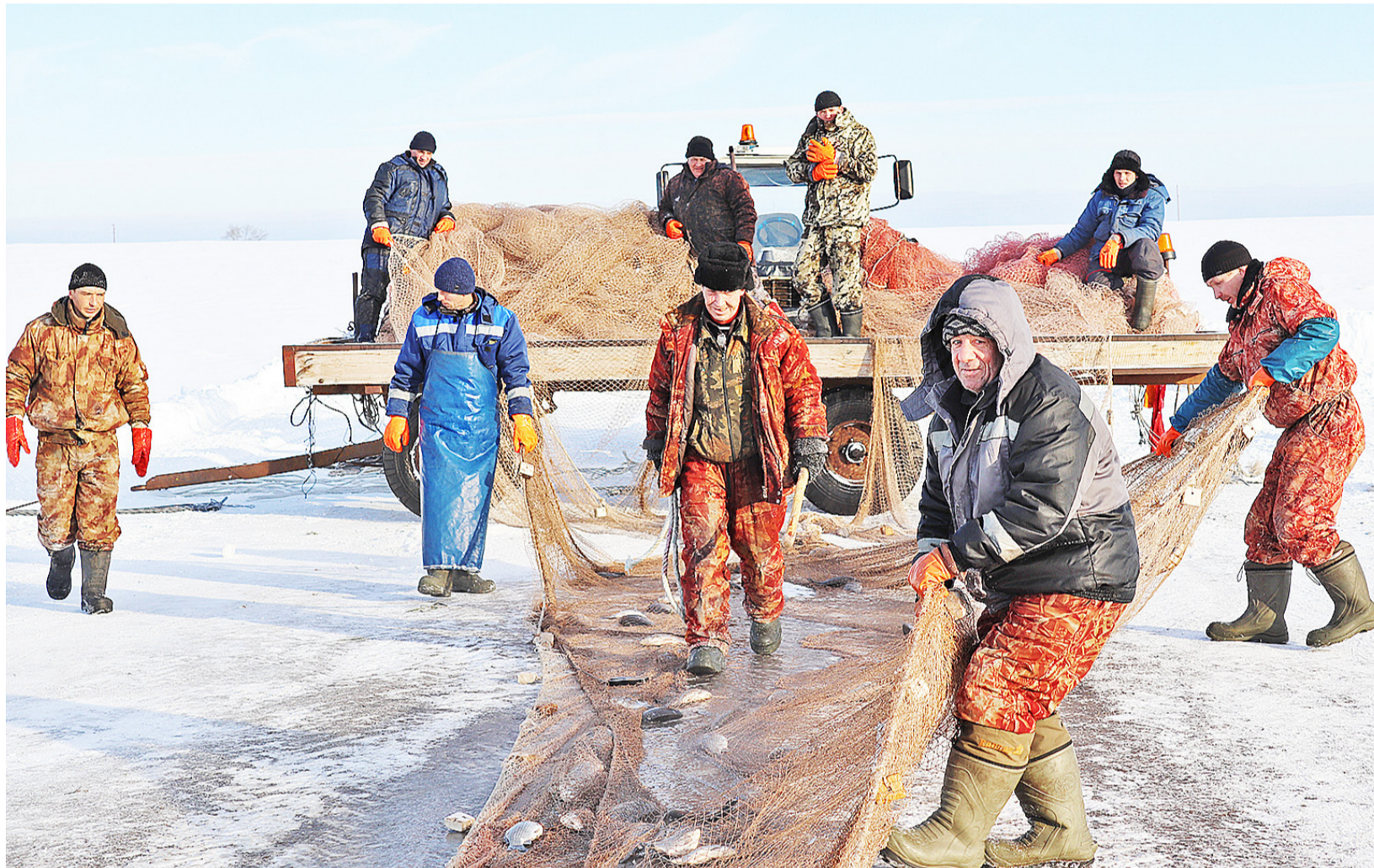
При рациональном использовании водоёмов рыбаки получают богатый улов

Труженики рыбного хозяйства продолжают вести добычу водных биоресурсов на озёрах юга Тюменской области