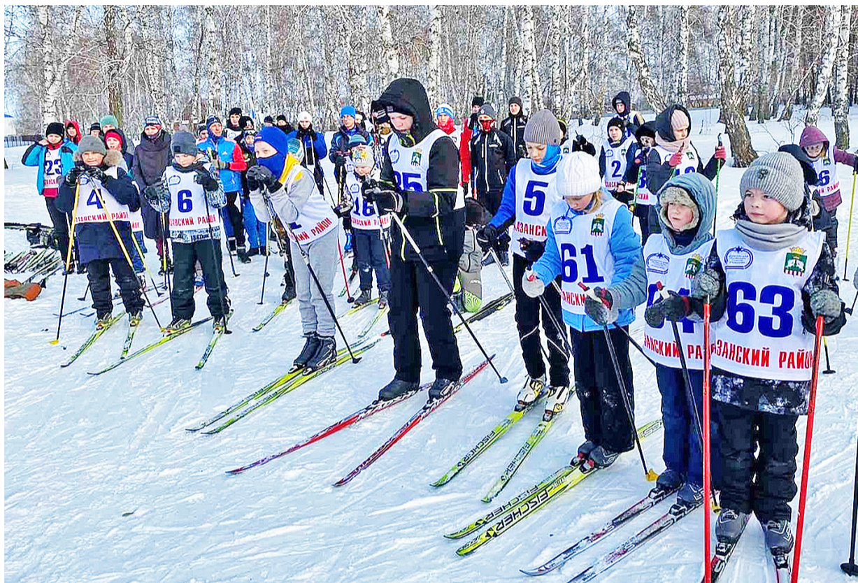
Лыжные гонки всегда привлекают юных спортсменов