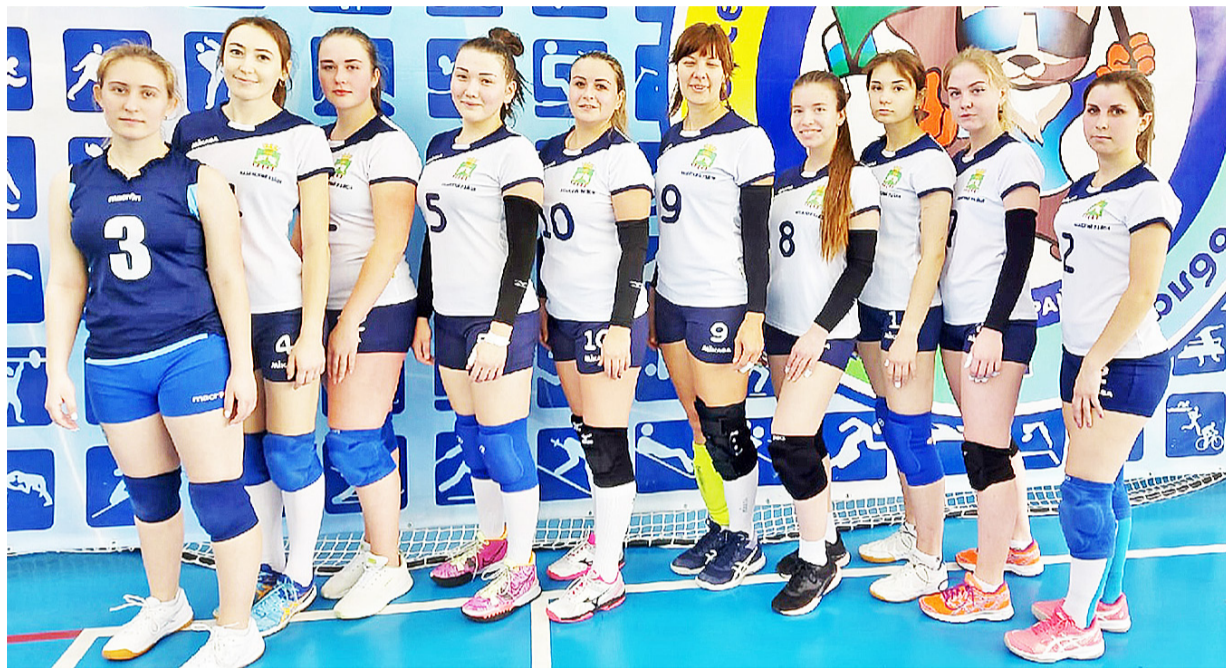
Женская сборная команда по волейболу Казанского района всегда в хорошей спортивной форме

Андрей ЗАДОРОВИЧ Фото предоставлено Казанской ДЮСШ