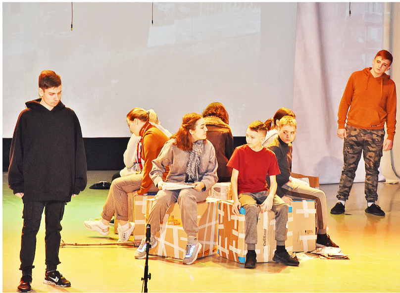
Сцена из спектакля «Про собак и людей»

В Казанском районе к этому проекту подключены краеведческий музей им. В.С. Аржиповского и районный дом культуры. Купить билеты по предлагаемым мероприятиям можно на сайте АУ «КРСТО «Досуг».