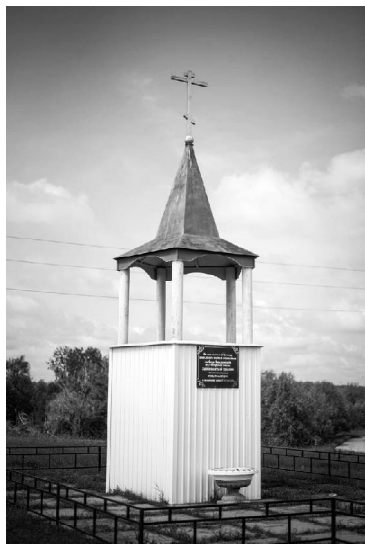
➤ Стела на Шаньгином бугре