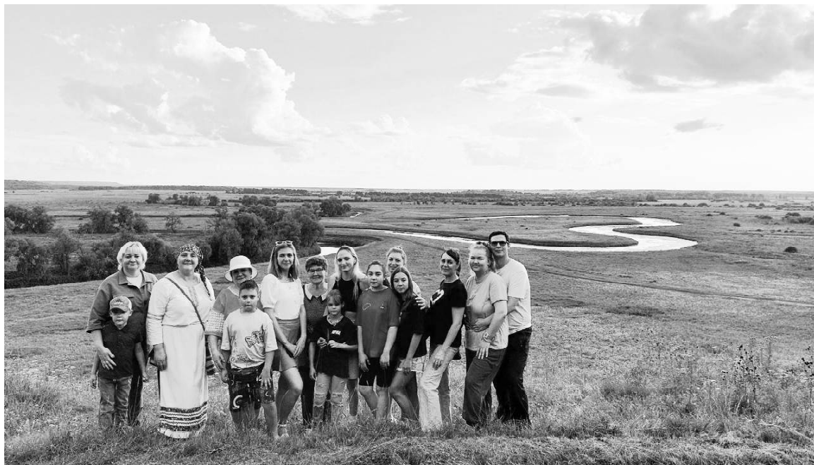
➤ У озера в форме сердца