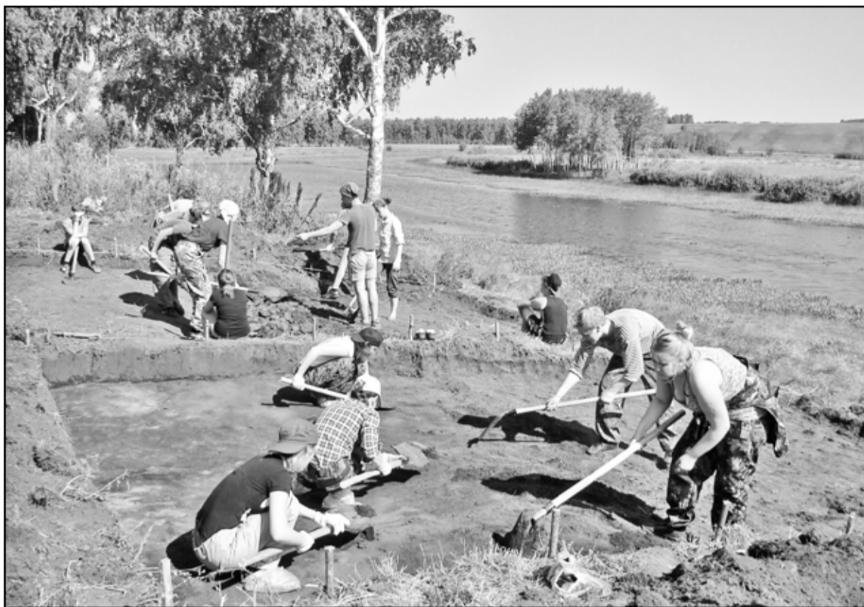
Раскоп участка делается по определённым канонам. Земля снимается слоями