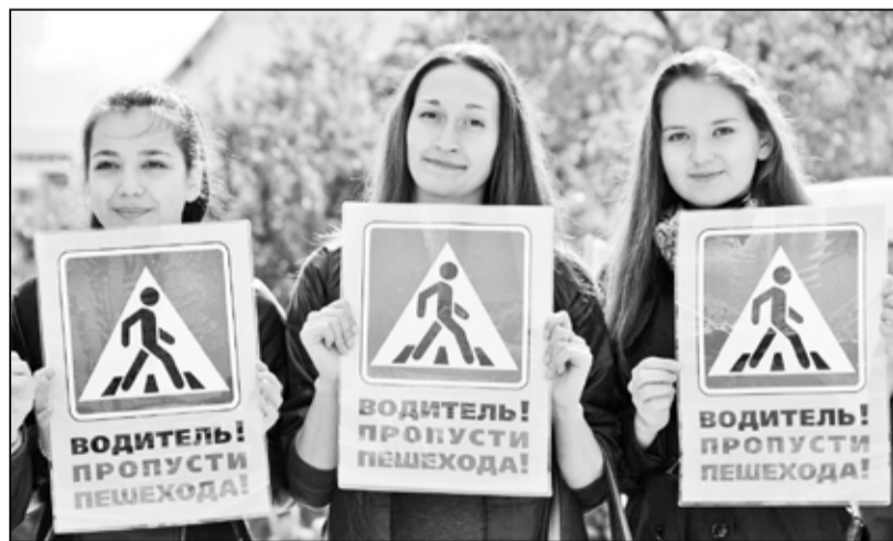
Акция на пешеходном переходе

ГИБДД призывает взрослых не нарушать правила перехода улицы, не подавать свои детям дурного примера. Родители обязаны повторить с детьми правила безопасного поведения на дороге и ежедневно напоминать ребёнку о том, что бережёного Бог бережёт.