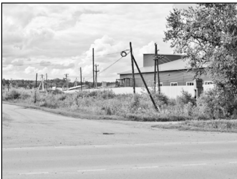
Тылы и фланги рыбозавода заросли бурьяном и кустарником