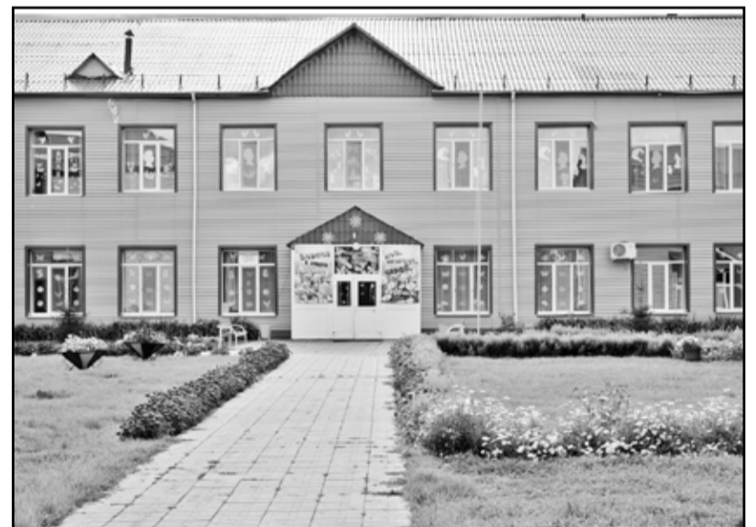
Территория Казанской начальной школы всегда ухожена

Утопает в цветах территория Казанского филиала Ишимского техникума. Глаз радуется и веселит разноцветье. Быть бы филиалу в числе победителей конкурса, если бы не небрежность, портящая красочную картину. Парадное крыльцо,