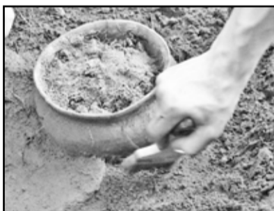
Уникальный состав почвы сохранил древнюю реликвию

его по косвенным признакам удалось в прошлом году. Здесь 2700 лет назад проживали представители ещё одной культуры – Журавлёвской. Подобных памятников на территории Приишмья было найдено пока только три. Один в Викуловском районе и два – в Казанском.