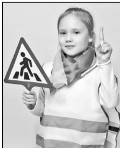
Внимание: ребёнок на дороге!

В Тобольске в дошкольных учреждениях проводится конкурс фотографий среди родителей «Мой ребёнок в детском автокресле», конкурс дорожной безопасности среди семей.