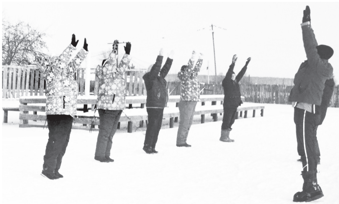
Разминка – обязательная часть каждого занятия.