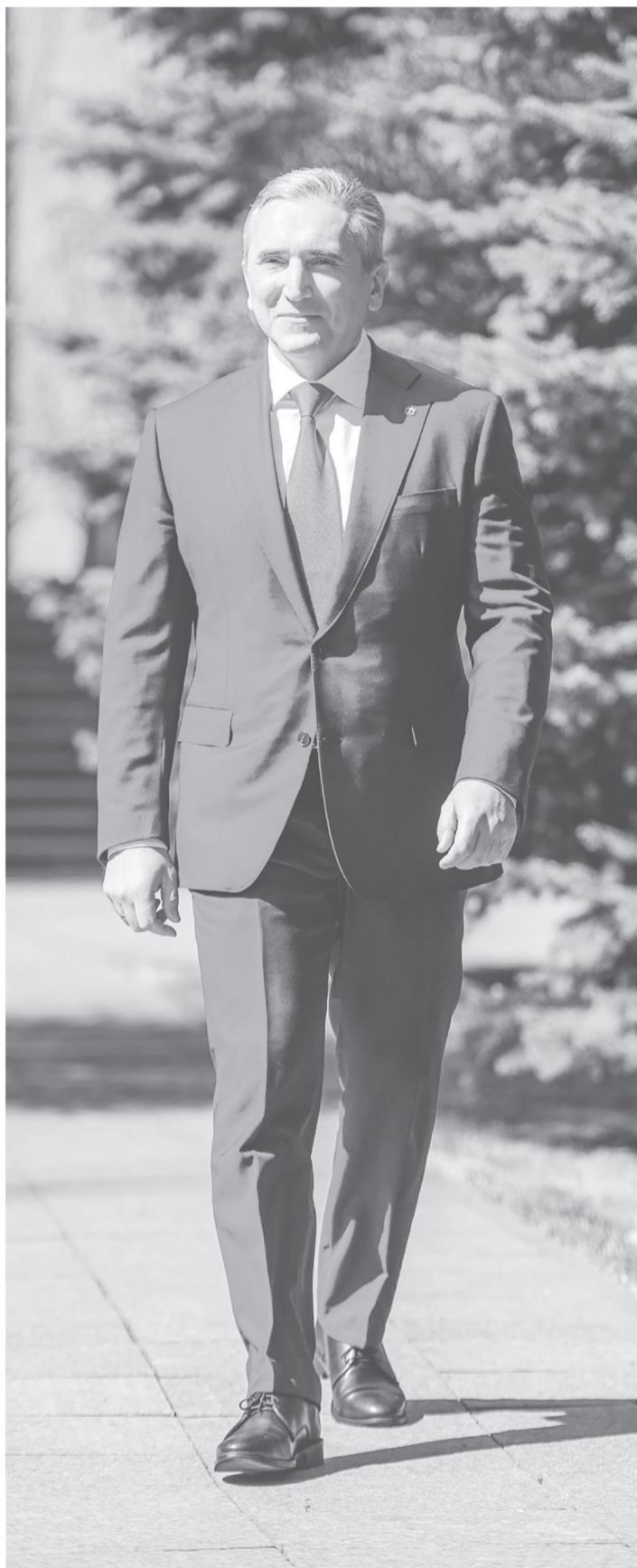
* Агитационный материал кандидата в губернаторы Тюменской области Александра Викторовича Моора публикуется безвозмездно в соответствии с частью 7 статьи 55 Избирательного кодекса (Закона) Тюменской области.