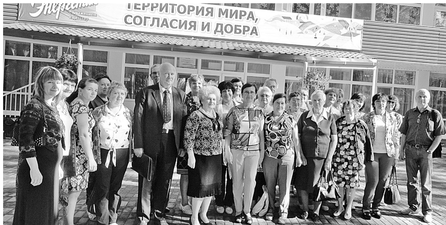
День приезда. Представители общественных организаций из 17 регионов Тюменской области.