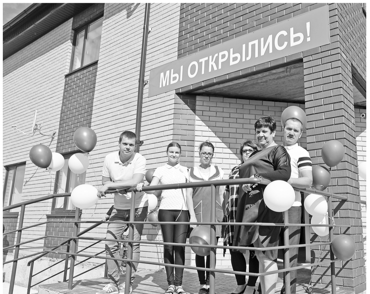
Счастливые моменты, заботы и хлопоты по строительству и оборудованию позади, впереди – не менее хлопотные будни.

– Мы принимаем заявки на банкеты, свадьбы, дни рожде-