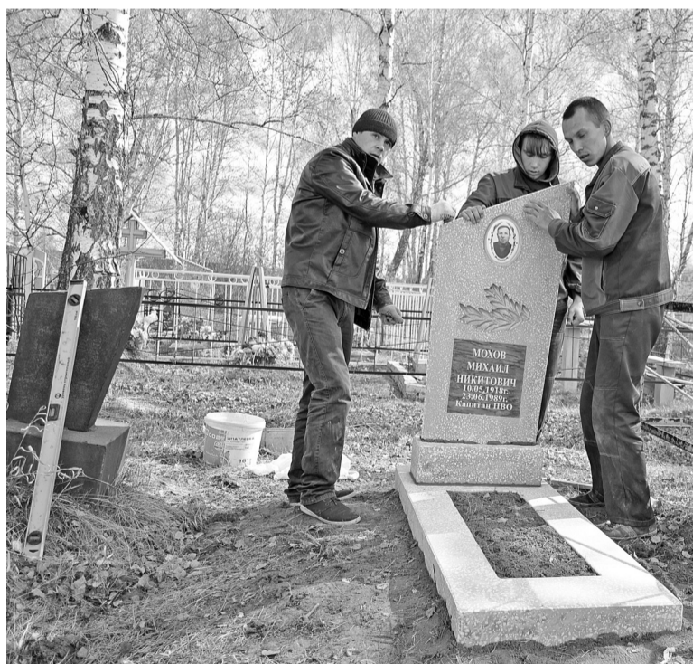
Это захоронение уже никогда не будет безымянным.