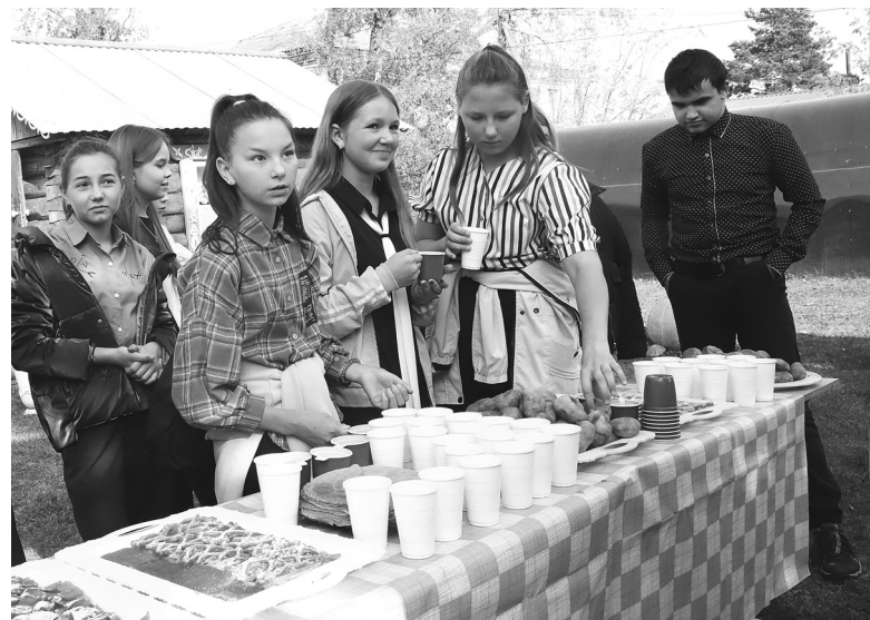
Экскурсия по сибирскому подворью, по русской традиции, закончилась гостеприимным застольем. Всех угощали чаем с пирогами – пышными, с вкусной начинкой