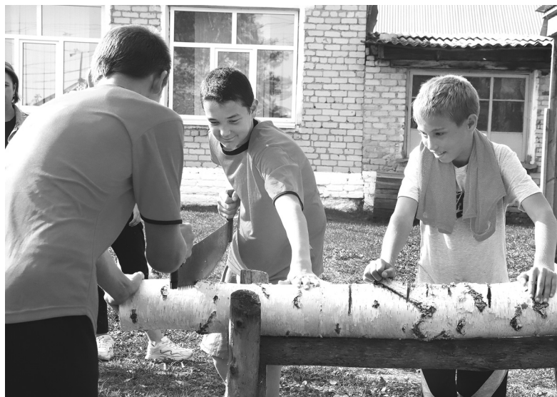
Ожил хозяйственный двор от мужской работы: приноровившись, мальчишки, оперевшись одной рукой на бревно, другой повели металлическое полотно ровно – зазвенела пила