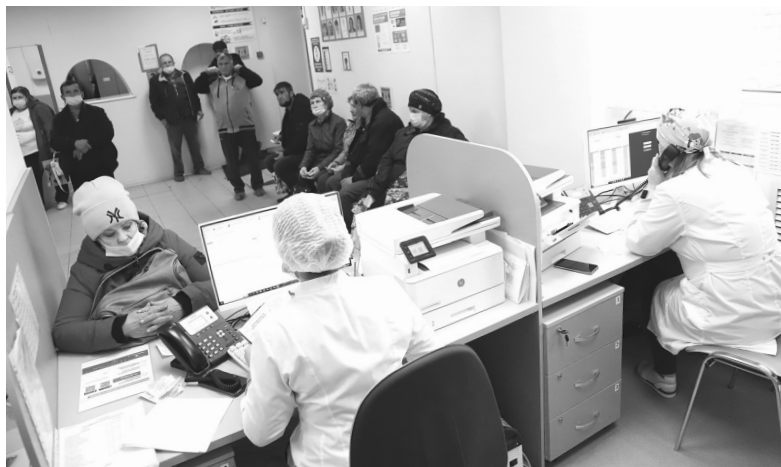
Понедельник. В регистратуре Голышмановской взрослой поликлиники работают несколько специалистов. Скопившаяся очередь продвигается быстро