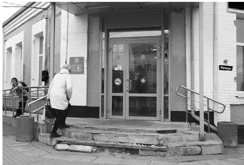
Разрушившееся крыльцо на входе в магазин не только представляет угрозу безопасности покупателей, но и портит внешний вид здания

Подготовила Яна ТЕРЁХИНА