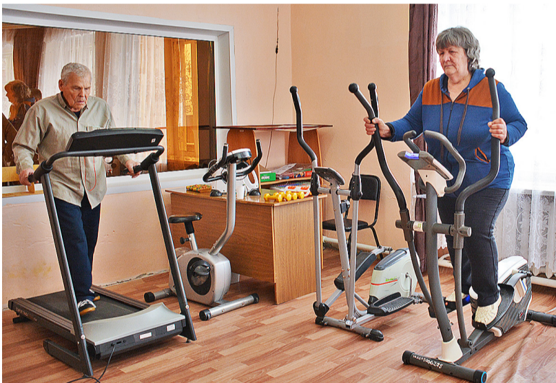
Выполнение упражнений на тренажёрах – полезное занятие для реабилитантов

Медицина различает два направления работы с инвалидами: реабилитацию и абилитацию. Реабилитация – это меры по восстановлению способностей человека к самообслуживанию и социальной жизни. Абилитация – процесс формирования новых способностей и привычек, отсутствовавших ранее. Обе системы направлены на улучшение качества жизни инвалидов, на их бытовую и общественную адаптацию. С реабилитантами в Казанском районе работают специалисты по реабилитации, специалист по трудовой деятельности, психолог, логопед, специалист по адаптив-