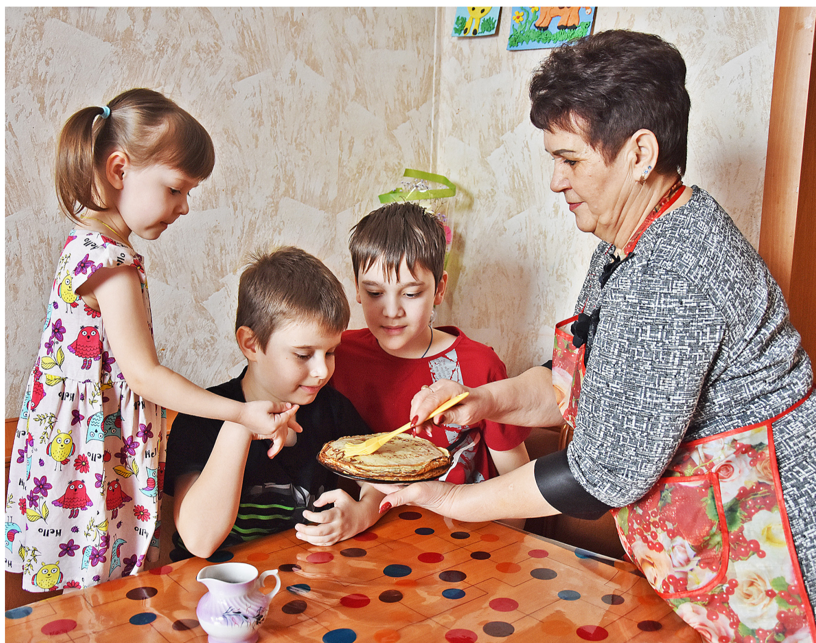
Блины с вареньем, шоколадом и сгущёнкой – любимое лакомство детей в семье Медянок, поэтому в Масленицу бабушкиным угощением детвора насладится вдвойне

Информации подготовила Виктория МАКСИМОВА