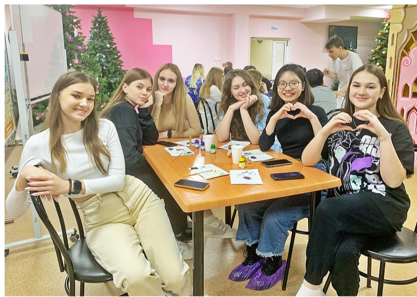
Участники мероприятия договорились не терять связи друг с другом

В заключение мероприятия мы много фотографировались, всем было интересно и весело, а языковой барьер не стал помехой для приятного общения. Ежедневно в лагере работали клубы по интересам: КВН, литературный клуб, клуб дискуссий, караоке. Каждый находил для себя что-то интересное. Как и в любом другом высшем учебном заведении в ВШПО работали кафедры «Мирологии и отечествоведения», «Шопологии и мамонтоведения», «Концертологии и флексологических наук», прошли встречи с интересными людьми, от души повеселились на общелагерных мероприятиях. Представители каждой кафедры должны были проводить мероприятия в течение всей смены. Таким образом, вечером 4 февраля был представлен первый про-