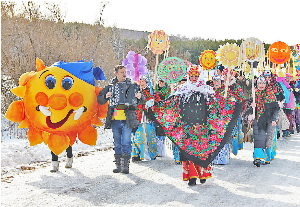
Масленицу казанцы отмечают весело и с размахом. 2020 год