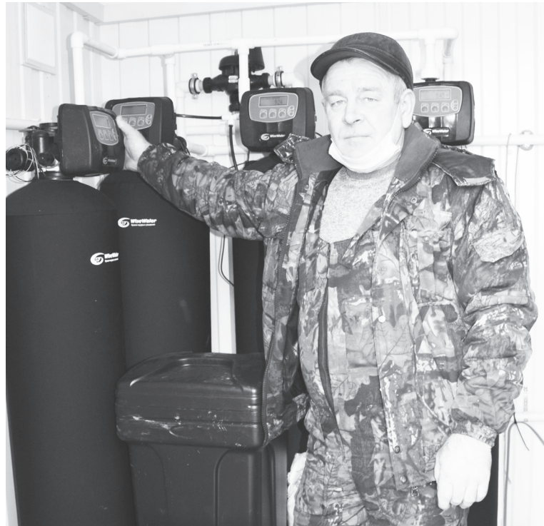
В этом году в Карагужёвой появился павильон чистой воды.