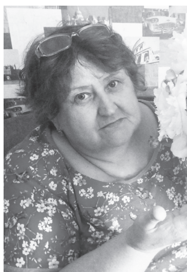
Мама – первое слово каждого малыша. Ведь это самый близкий

С любовью о своих мамах отзываются их дети