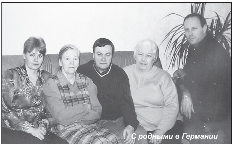
С родными в Германии

женщин взяли в трудармию. Из ссыльных остались старики и дети. «На ногах» – только отец и его брат. Им приходилось хоронить умерших немцев. Их закапывали без гробов – где их было взять. И отец очень переживал. Расстраивался, что не может обеспечить семью. Он сдал, сильно похудел. Помню, как-то январским вечером проговорил с нами допоздна: учите, учите. Будет легче. А утром – умер. Из всяких ящиков, какие могли насобирать по деревне, какие были с собой, брат сколотил ему гроб. Перезимовать в Сибири не каждому было под силу!