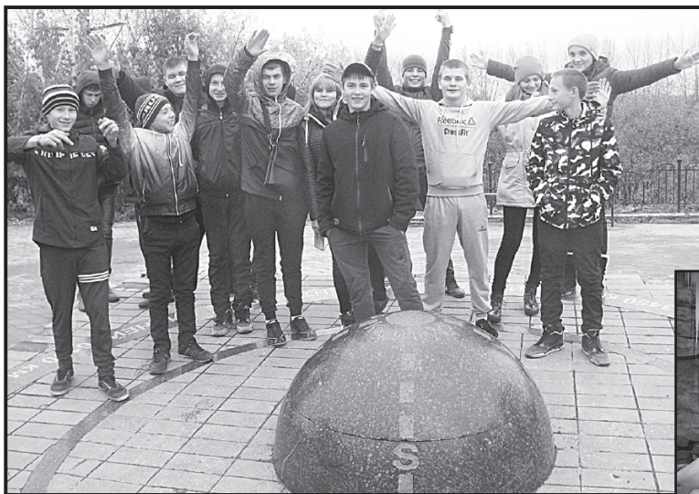
Юные юргинские путешественники

Самым зрелищным и захватывающим стал осмотр диорамы «Форсирование Днепра». Её можно рассматривать не только вблизи, но и наблюдать за ходом переправы через подлинную артиллерийскую стереотрубу из командного блиндажа. И всё это – под вой снарядов и рёв самолётов, которые ведут воздушный бой в 3D-проекции прямо над головами посетителей! Что